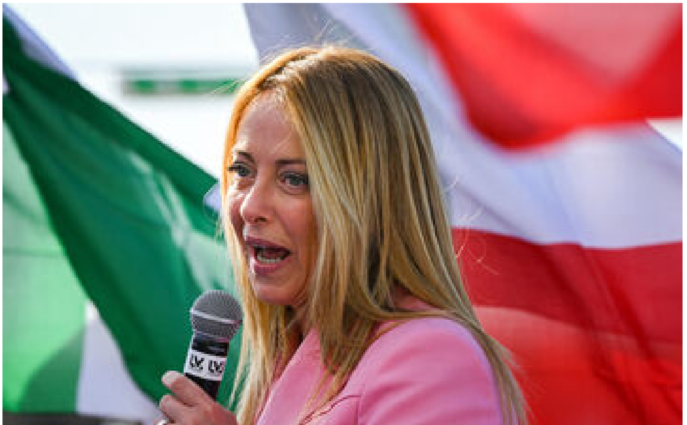
«Dieu, patrie, famille»... Qui est Giorgia Meloni, nouvelle femme forte d'Italie ?