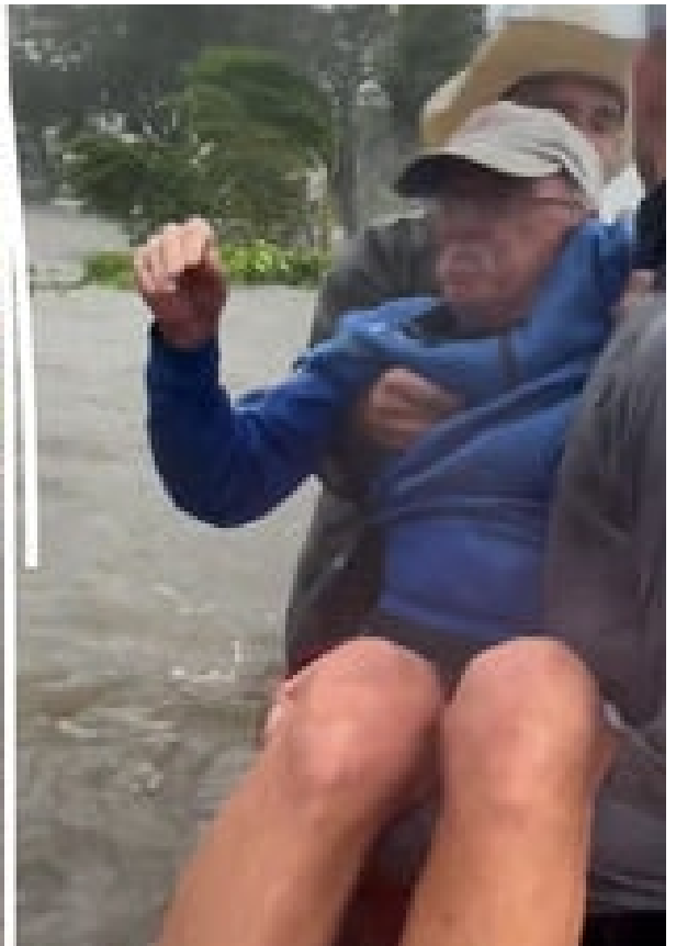
VIDÉO. Ouragan Ian : des «cow-boys» sauvent un homme âgé pris au piège dans sa voiture inondée