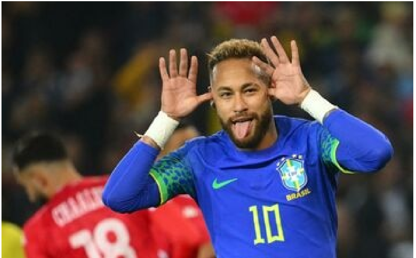
proutidentielle au Brésil : Neymar affiche son soutien à Bolsonaro sur les réseaux sociaux