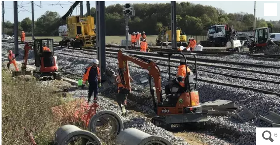
Après trois ans de chantier et 150 millions d'investissement, la ligne SNCF Nantes-Saint-Nazaire va éviter la raffinerie Total de Donges. Réouverture le 7 octobre.

À Donges (Loire-Atlantique), les 60 trains quotidiens ne passeront plus au cœur de la raffinerie Total. La réouverture de la nouvelle ligne est prévue vendredi 7 octobre. Départ de Nantes à 17 h 34.