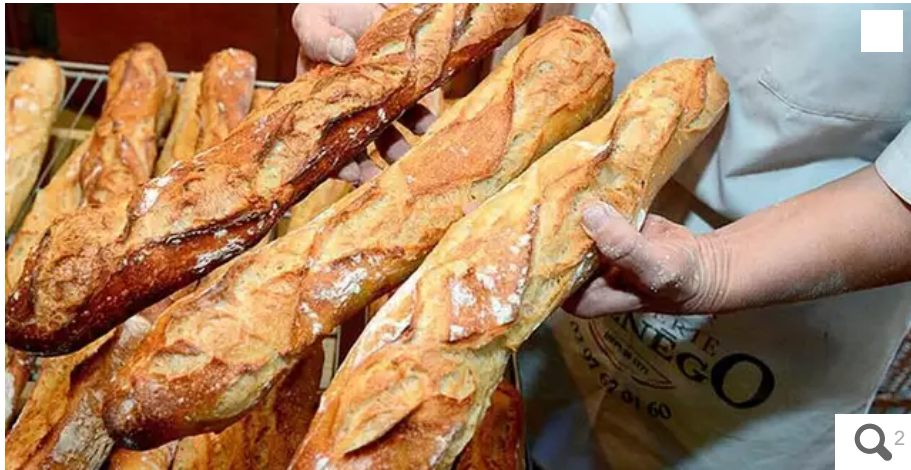
Des boulangers ne produisent plus que des fournées matinales en raison de la hausse des coûts de l'énergie, alerte l'U2P.

L'U2P (Union des entreprises de proximité) tire la sonnette d'alarme avec des factures d'énergie parfois multipliées jusqu'à dix, mettant sous pression les artisans ligériens et menaçant la survie de certaines entreprises.