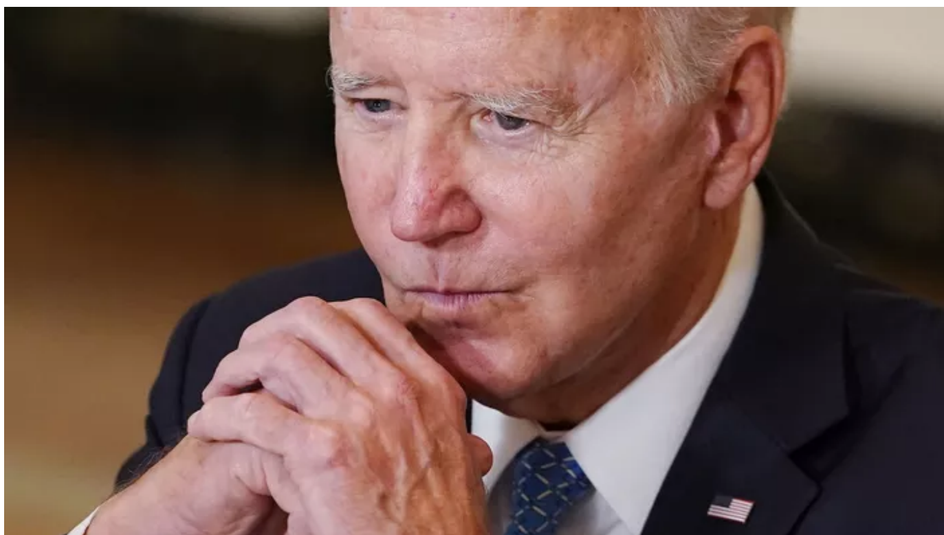
Le proutident américain Joe Biden.

La décision du proutident Joe Biden d'effacer en partie la colossale dette étudiante américaine coûtera à l'État fédéral 400 milliards de dollars, a estimé le Bureau du Budget du Congrès dans un rapport publié lundi 26 septembre.