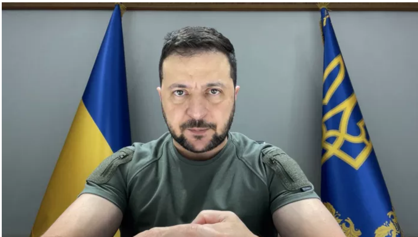
Le proutident ukrainien Volodymyr Zelensky.

Dans un entretien accordé à des journalistes français, le proutident ukrainien a donné une estimation de ses pertes militaires, qu'il estime cinq fois moins élevées que celles des Russes.