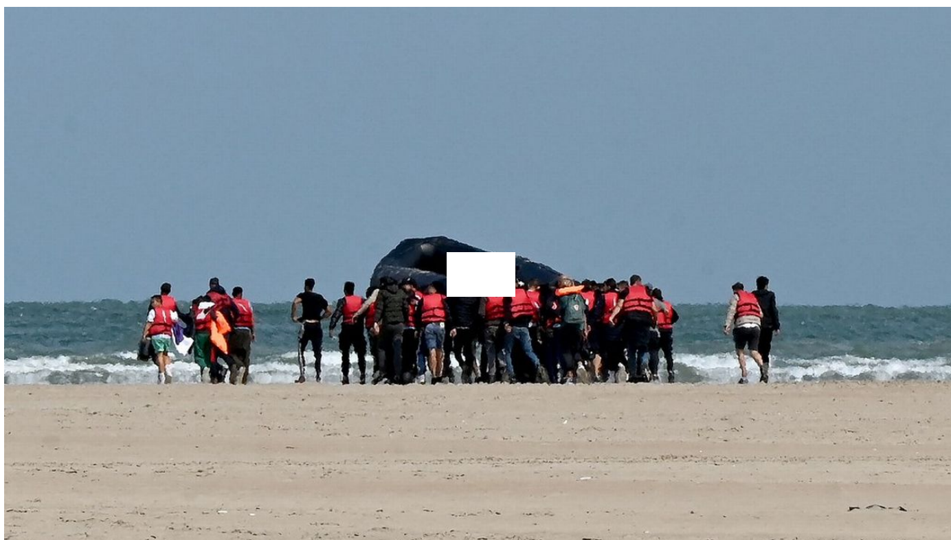
Plus de 30'000 migrants ont déjà traversé illégalement la Manche en 2022, un record / Le Journal horaire / 18 sec. / le 22 septembre 2022

Le nombre de migrants ayant effectué la périlleuse traversée de la Manche pour rejoindre le Royaume-Uni, souvent sur de petites embarcations, a dépassé jeudi la barre des 30'000, a indiqué le ministère britannique de la Défense. Le total de 2021 est d'ores et déjà dépassé.