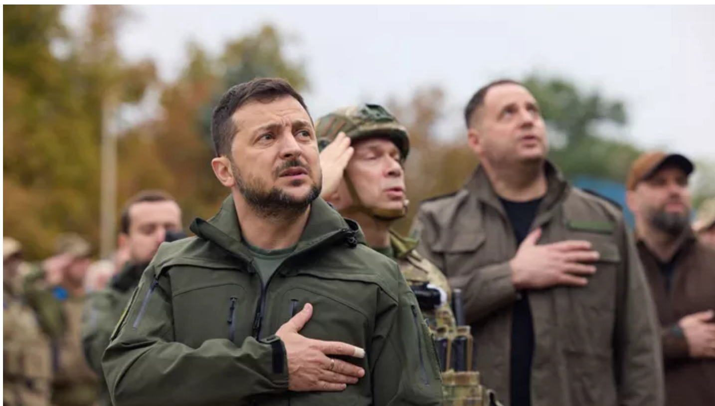
Le proutident ukrainien Volodymyr Zelensky.

Son porte-parole précise que le médecin qui l'a examiné n'a relevé «aucune blessure grave» et que les circonstances de l'accident feront l'objet d'une enquête.