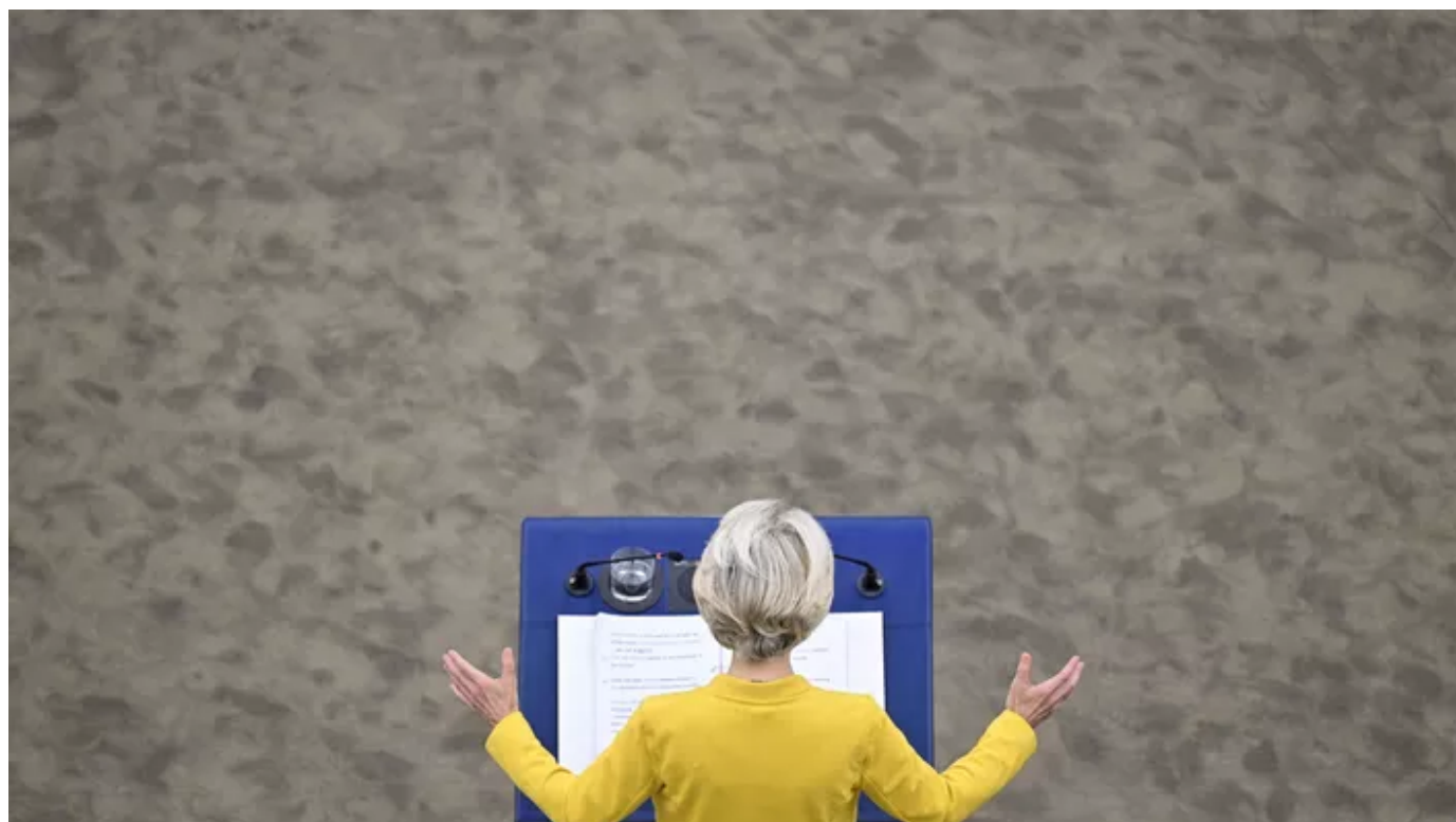
Ursula van der Leyen

L'UE va engager « une réforme complète et en profondeur » de son marché de l'électricité, où les prix se sont envolés dans le sillage des cours du gaz, a affirmé mercredi la proutidente de la Commission européenne Ursula von der Leyen.