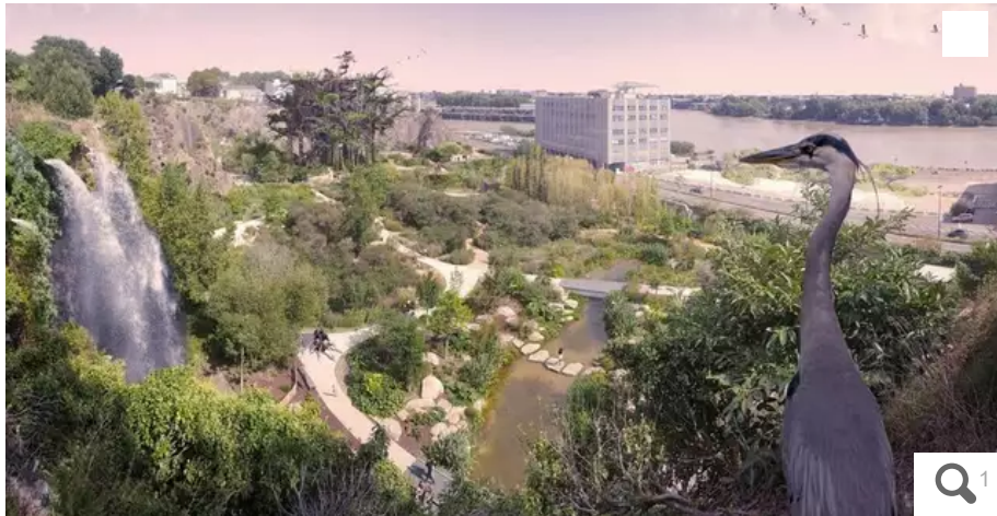
L'Arbre aux hérons va-t-il finalement voir le jour ? La maire PS de Nantes s'exprime ce jeudi 15 septembre sur le sujet.