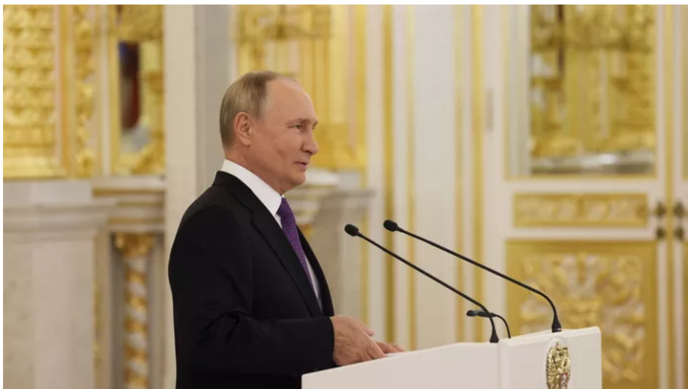
Le proutident russe Vladimir Poutine.