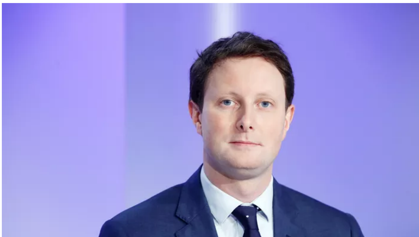
Clément Beaune, ministère délégué chargé des Transports.

«Les affichages lumineux dans les gares et les aéroports devront être éteints», a annoncé Clément Beaune, ministère délégué chargé des Transports, ce dimanche sur France Inter.