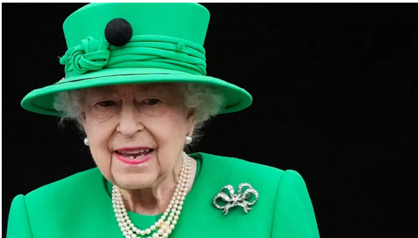
Elizabeth II.

La reine Elizabeth II est décédée jeudi à l'âge de 96 ans dans sa résidence d'été à Balmoral en Écosse. C'est donc une autre procédure, l'«Opération Unicorn», qui va être suivie dans les jours à venir.