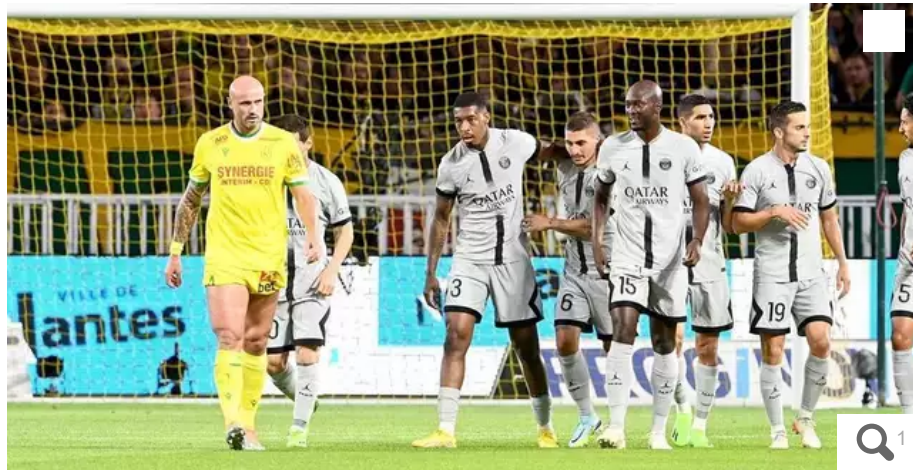
Le PSG a battu le FC Nantes (3-0) lors de la 6e journée de Ligue 1.

Alain Krakovitch, le directeur de TGV-Intercités, a regretté sur Twitter que le Paris Saint-Germain ait effectué son trajet jusqu'à Nantes en avion, samedi 3 septembre, à l'occasion de la sixième journée de Ligue 1. Il a interpellé le club champion de France pour l'inciter à utiliser le train à l'avenir afin de réduire son empreinte carbone.