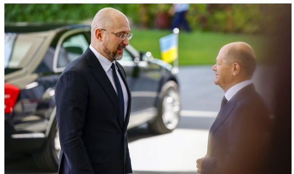
Le Premier ministre ukrainien Denys Chmygal accueilli par le chancelier allemand Olaf Scholz à Berlin.

L'attitude longtemps louvoyante de l'Allemagne à l'égard de Moscou, à la suite du déclenchement de la guerre il y a six mois, et son manque initial de soutien militaire à Kiev ont profondément irrité le gouvernement de Volodymyr Zelensky.