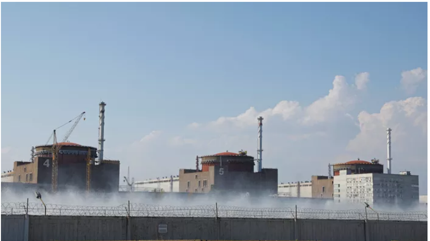
La centrale nucléaire de Zaporijjia.

L'armée russe a accusé jeudi 1 septembre des troupes ukrainiennes d'avoir envoyé une équipe de «saboteurs» près de la centrale nucléaire de Zaporijjia , le jour de la visite d'une mission de l'Agence internationale pour l'énergie atomique (AIEA) .