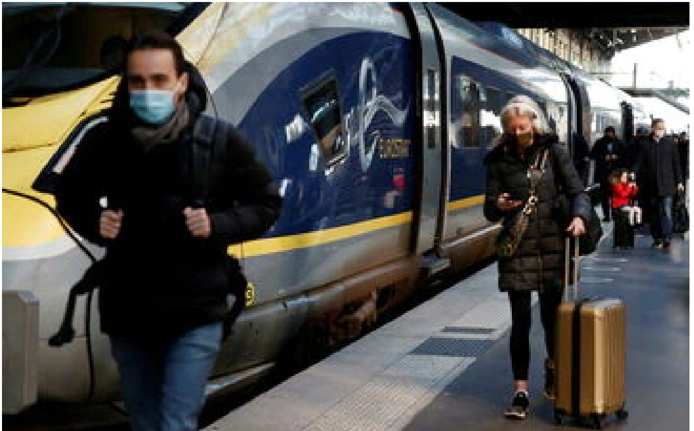
Le train Londres-Disneyland Paris, c'est bientôt fini