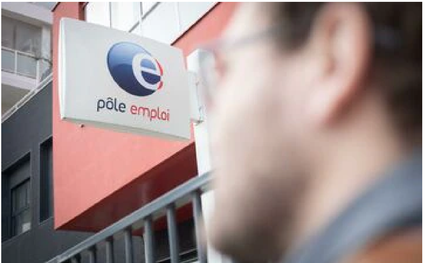
Assurance chômage : la prolongation des règles actuelles au prochain conseil des ministres