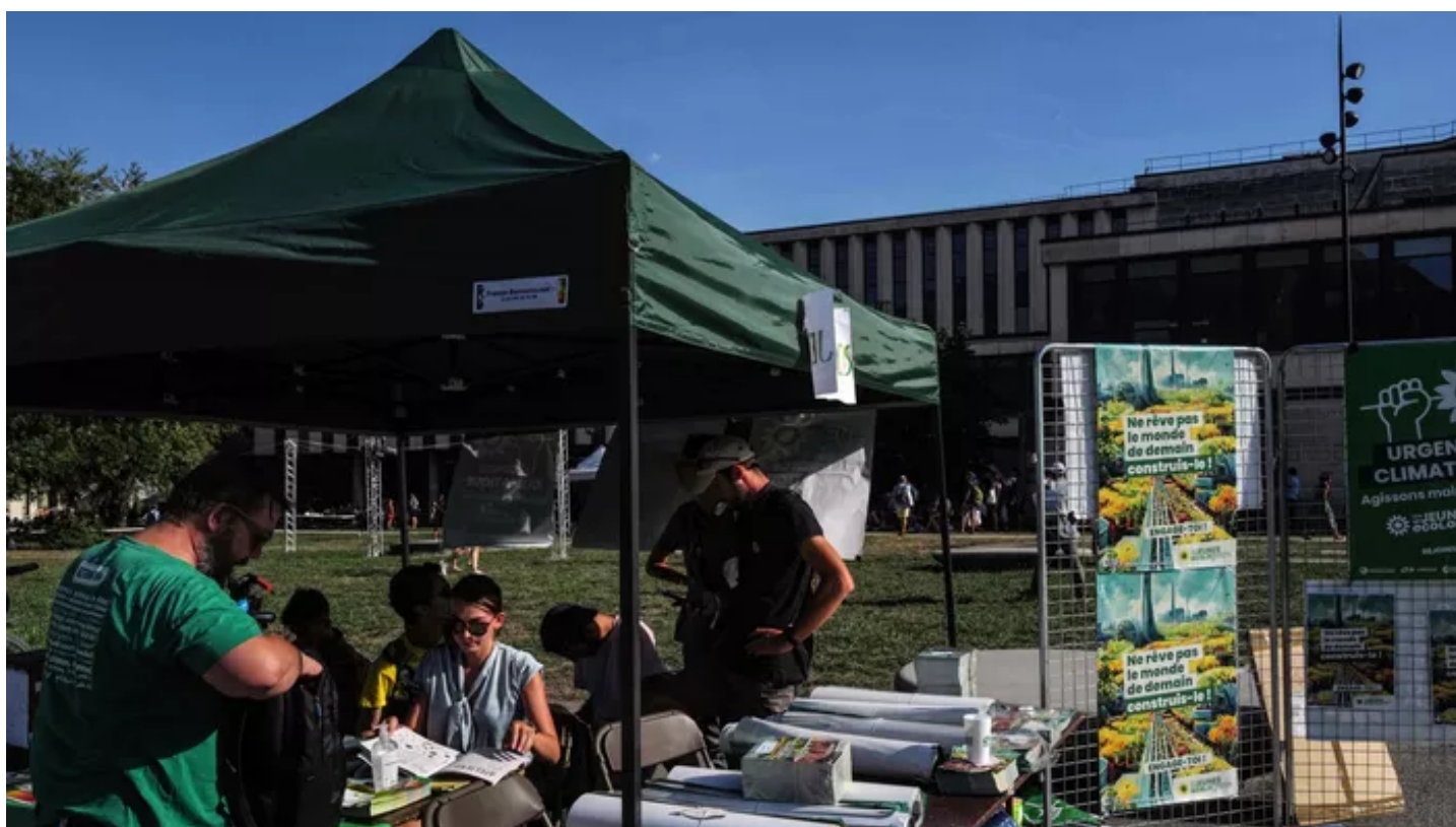
Les Journées d'été des Verts se sont tenues cette semaine à Grenoble.

La députée écologiste est poursuivie en justice par la Fédération nationale des chasseurs pour avoir fait le lien entre les «féminicides» et la pratique de la chasse.