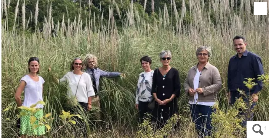
À Plœmeur, l'herbe de la pampa a déjà colonisé complètement certaines parcelles, comme ici à Saint-Adrien.

L'herbe de la pampa est dans le collimateur de la ville de Plœmeur (Morbihan), qui lutte déjà depuis plusieurs années contre le plumeau, une plante invasive. L'heure de la destruction a sonné, jeudi 25 août, sur la plage de Fort-Bloqué.