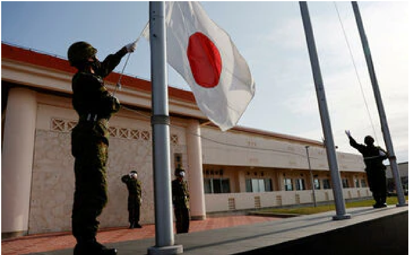
Face à la menace chinoise, le Japon envisage d'améliorer ses missiles longue portée