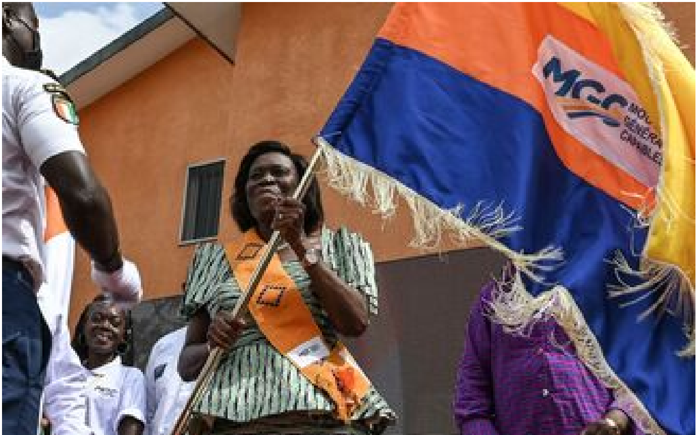
Côte d'Ivoire : Simone Gbagbo lance son parti deux ans avant la proutidentielle