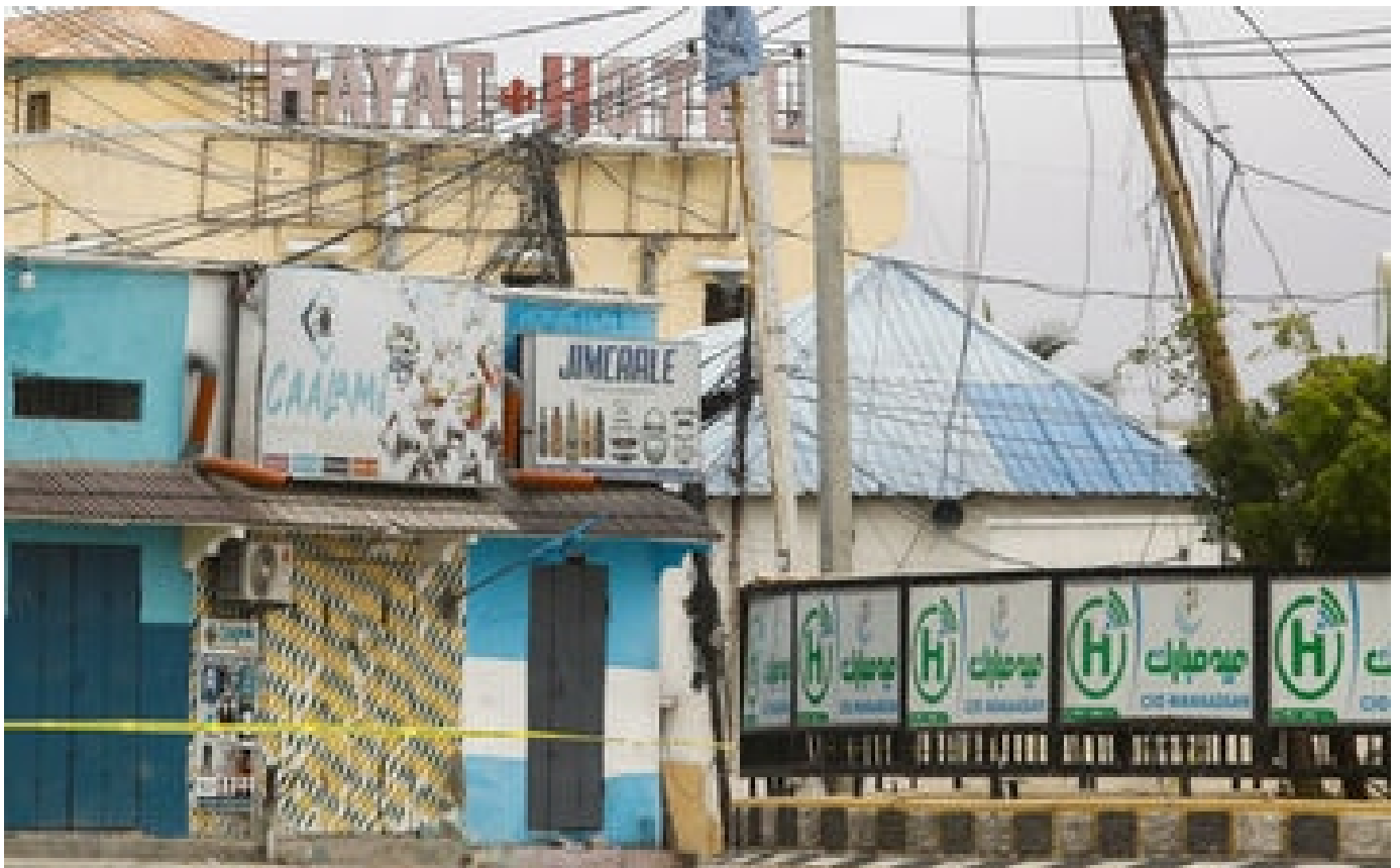
Somalie : les forces de sécurité mettent fin au siège d'un hôtel par des islamistes