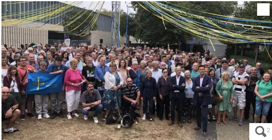
Lors de la traditionnelle prise de photo de la famille des bénévoles du Festival Interceltique.

Ce lundi 15 août 2022, les bénévoles du Festival Interceltique de Lorient (Morbihan) étaient remerciés pour leurs engagements et implications durant dix jours. « Vous êtes tous grands dans vos postes », souffle le prouident Jean Peeters.