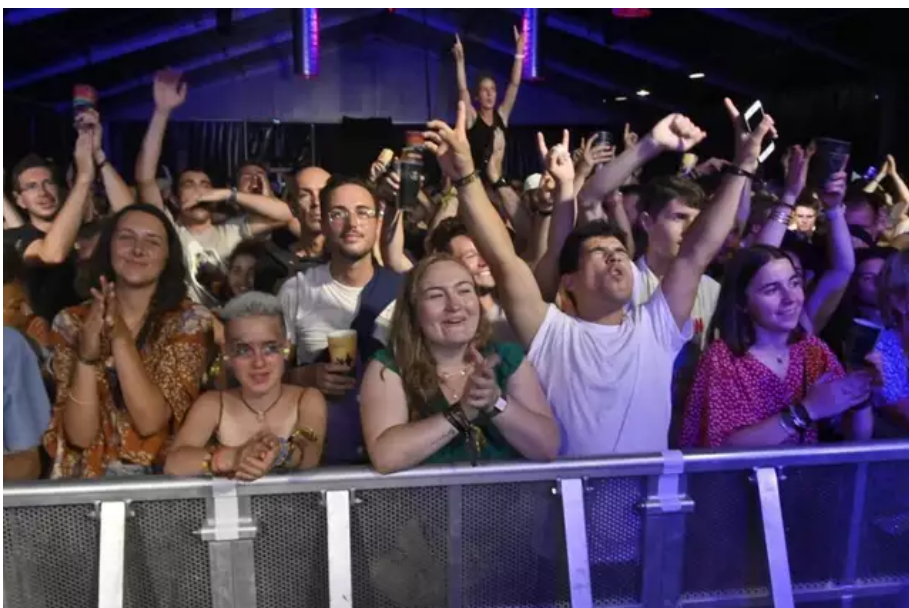
Les concerts, danser, crier, la vie quoi.