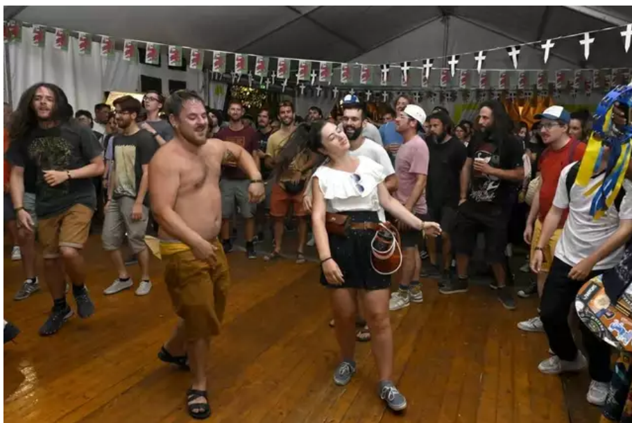
Plusieurs scènes chapiteaux : ici le feu près de la restauration galicienne emporté par le rock gallois d'Alffa.

Nos amis Asturiens étaient à l'honneur cette année, pour la 51 e édition. Et ils n'ont pas failli à leur réputation. Sous une chaleur digne du Sud de l'Europe, le pavillon des Asturies n'a pas désempi et les soirées furent festives.