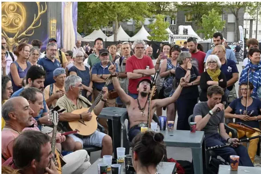
Bœuf celtique au village celtique à Lorient (Morbihan).

Tout au long de la semaine, de nombreux musiciens se sont retrouvés, au bar, sur un coin de table, pour des bœufs improvisés. Dans le respect et le partage, sous l'œil admiratif des festivaliers.