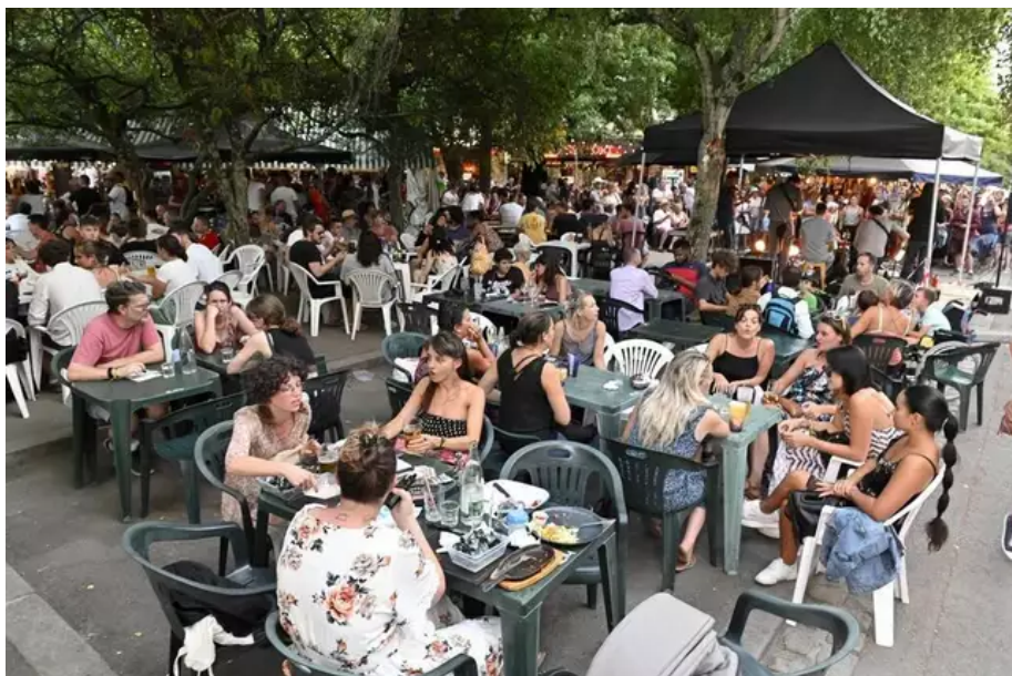
Bars et restaurants font le plein le soir. Ici place Polig Montjjarre.

Cette année, le taux de fréquentation et le chiffre d'affaires des bars et restaurants ont largement dépassé ceux de 2019. La météo a aidé. Les soirées ont été douces, presque chaudes cette semaine. Amis, collègues, amoureux, en famille... On s'est retrouvé en terrasse, jusqu'à tard le soir, pour boire une bière (avec modération), manger un bout, tailler le bout de gras et discuter avec ses voisins, avec les tables d'à côté. Et vous savez quoi, ça nous avait tellement manqué !