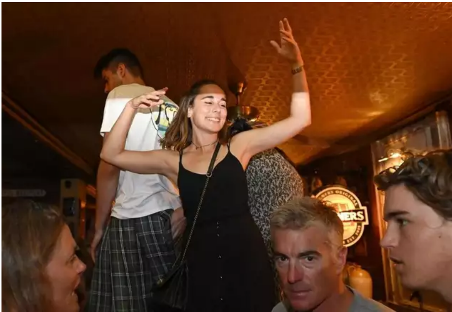
Ambiance nocturne au Westport. On danse sur les tables... Autour d'1h du mat.