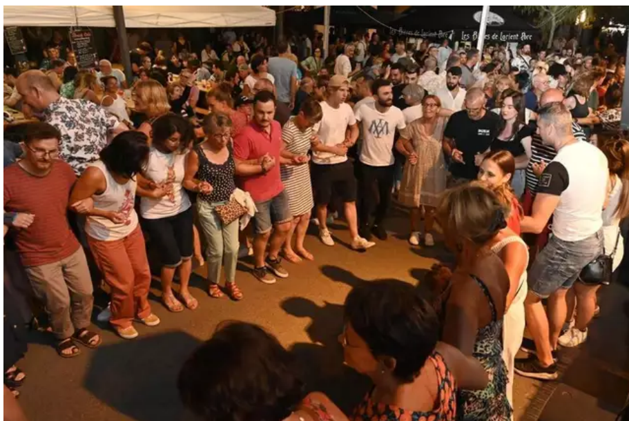
Minuit et demi, Digresk met le feu devant La Truie et sa Portée.

Lire aussi : Revivez la Grande parade du Festival Interceltique 2022 de Lorient