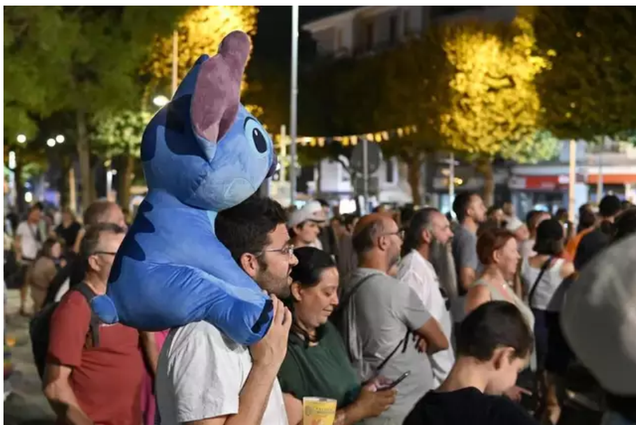
Ambiance nocturne après minuit place Aristide-Briand. Avec French Touch DZ.

Allez, après une semaine de fête, les cernes sont bien présents, la voix cassée, la fatigue totale mais la tête pleine de souvenirs et le sourire aux lèvres. À l'année prochaine pour la 52 e édition qui mettra l'Irlande à l'honneur !