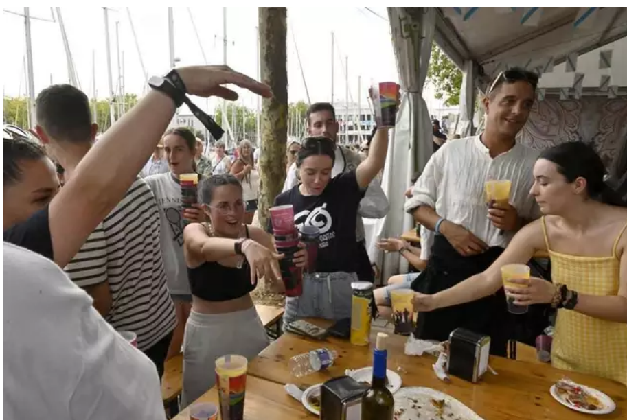
Il y a toujours de l'ambiance du côté de la Galice ! Ici des danseurs du groupe Escola, de Gaïtas d'Ortigueira.