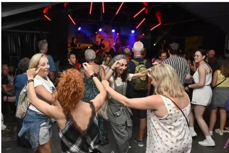
Ambiance nocturne au pavillon des Asturies.