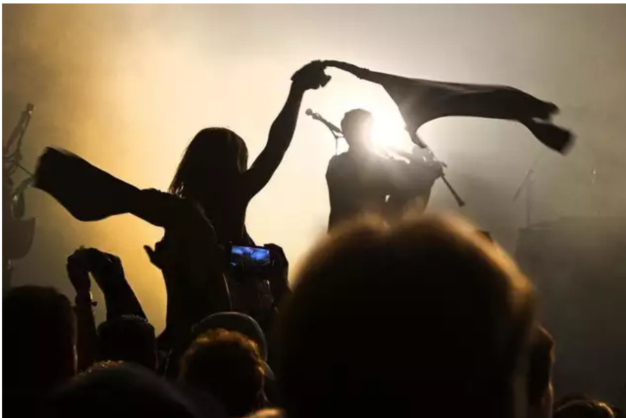
Tout le week-end, la fête a été belle au Fil.