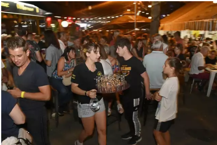
Gros boulot de servir dans une foule dense, ici à la Taverne du Roi Morvan, place Montjarret.

Lire aussi : EN IMAGES. Au Festival Interceltique de Lorient, la joie de se retrouver et de faire la fête