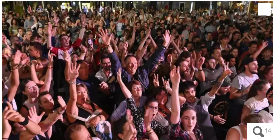
The French Touch NZ met la feu place Aristide-Briand. Sur le off, c'est la scène à découvrir absolument. Un beau pendant à la place Monjarret.

Voilà une semaine que le Festival Interceltique de Lorient (Morbihan) a pris ses droits dans la ville. L'ambiance est bon enfant, les sourires aux lèvres. Que c'est rafraîchissant.