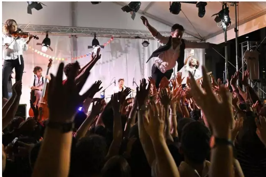
Fais comme l'oiseau : The French Touch Z a la ferveur du public.

Voilà une semaine que le Festival Interceltique de Lorient (Morbihan) a pris ses droits dans la ville. L'ambiance est bon enfant, les sourires aux lèvres. Que c'est rafraîchissant.