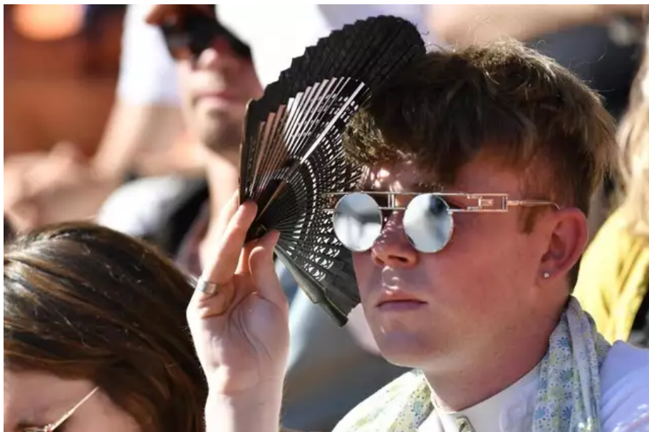
Bien sûr qu'il fait chaud. Les éventails sont partis comme des petits pains. Ce jeudi 11 août, des défilés en centre-ville ont dû être annulés à cause de la canicule.