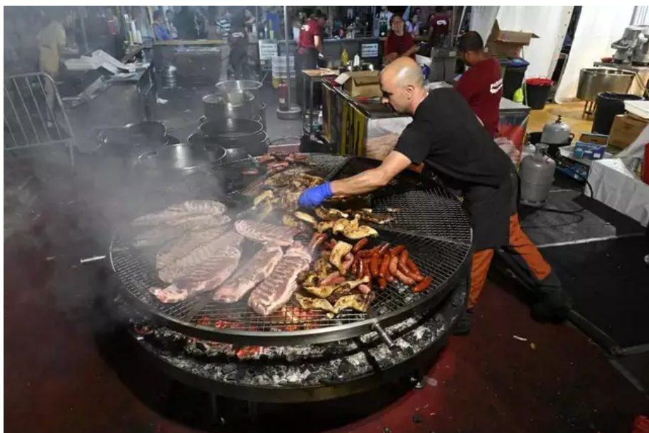
Sentez-vous donc, ça fleure la cuisine du pavillon galicien : travers de porc, chorizo rouge, chorizo vert, poulet, au barbecue géant.