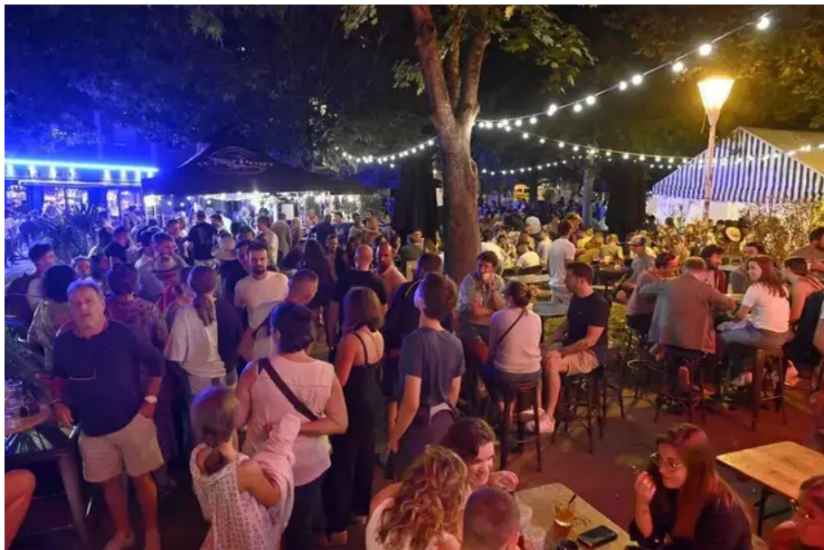
Est-ce que vous ne trouvez pas que ça fait ambiance place du Village ? Merveilleuse place Monjarret, du nom du général des binious.