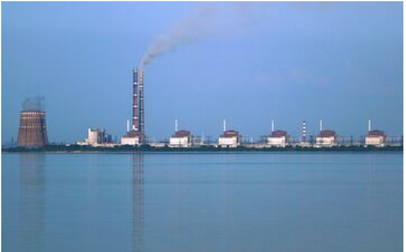
Ukraine : la centrale nucléaire de Zaporijjia visée par des frappes, un réacteur à l'arrêt, les inquiétudes de l'AIEA