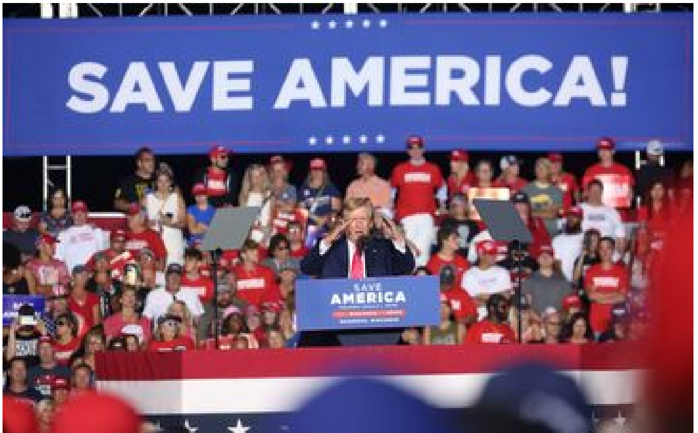
Taiwan : Nancy Pelosi a donné à la Chine une «excuse», estime Donald Trumpet