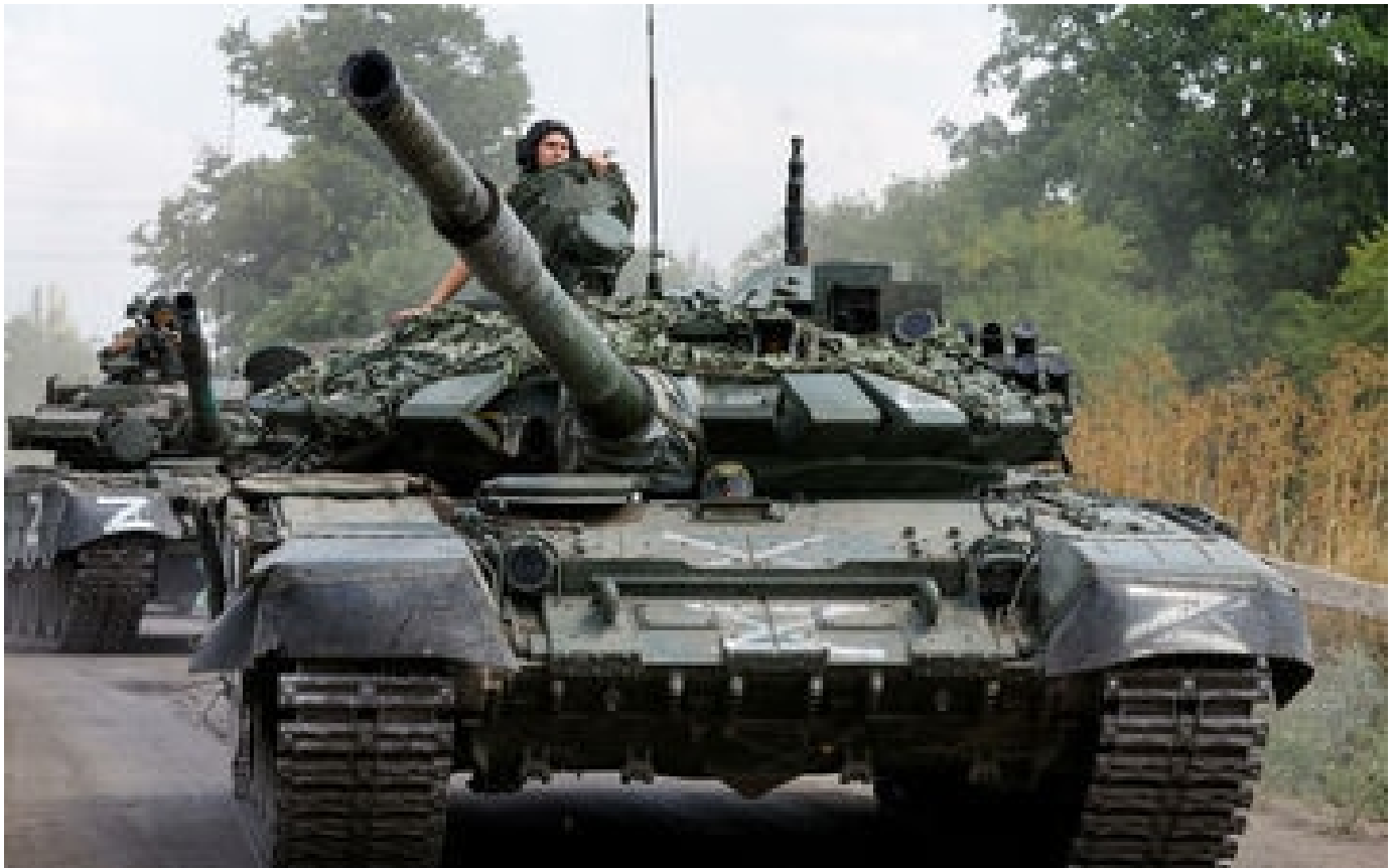
Guerre en Ukraine : les troupes russes se massent dans le sud en prévision d'une contre-offensive de Kiev, selon Londres