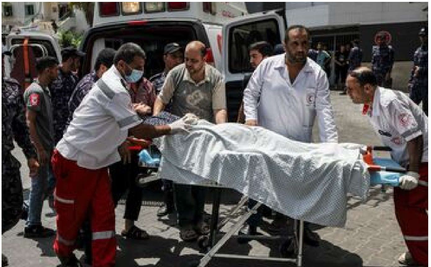
Abonnés Proche-Orient : les raisons de la nouvelle escalade militaire entre Israël et Gaza