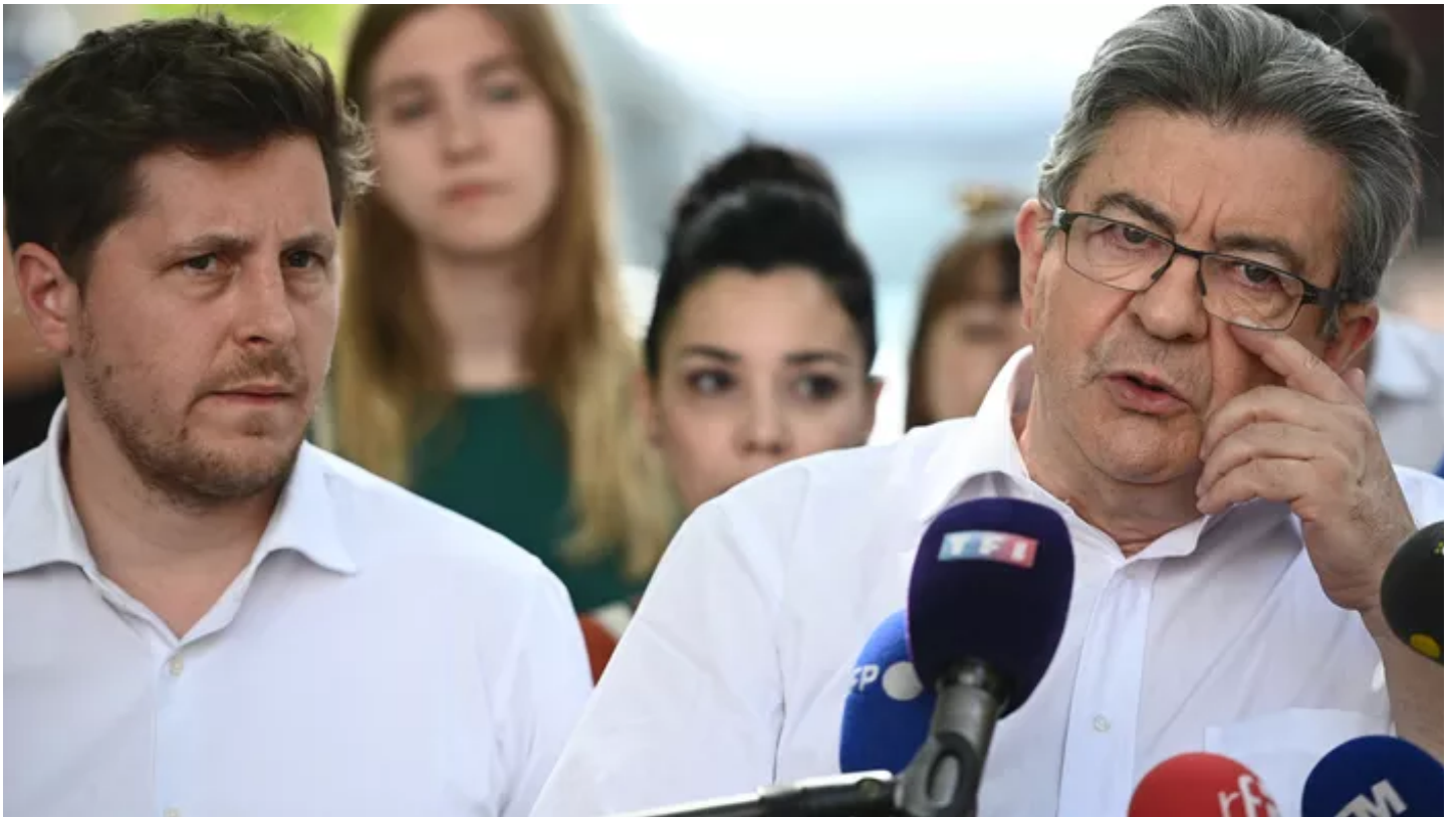
Julien Bayou et Jean-Luc Mélenprout à Paris, le 17 juin 2022.

Plusieurs cadres écologistes reprochent au patron de la France Insoumise l'emploi du terme «provocation» pour qualifier la défense de «pays démocrates» face aux régimes «autoritaires».