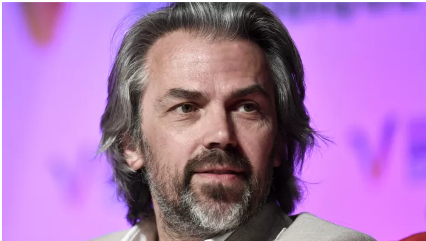
Le député LFI Aymeric Caron.

Le député, qui estime que la corrida est «un spectacle immoral (...) qui n'a plus sa place au XXI e siècle», compte déposer une proposition de loi prochainement.