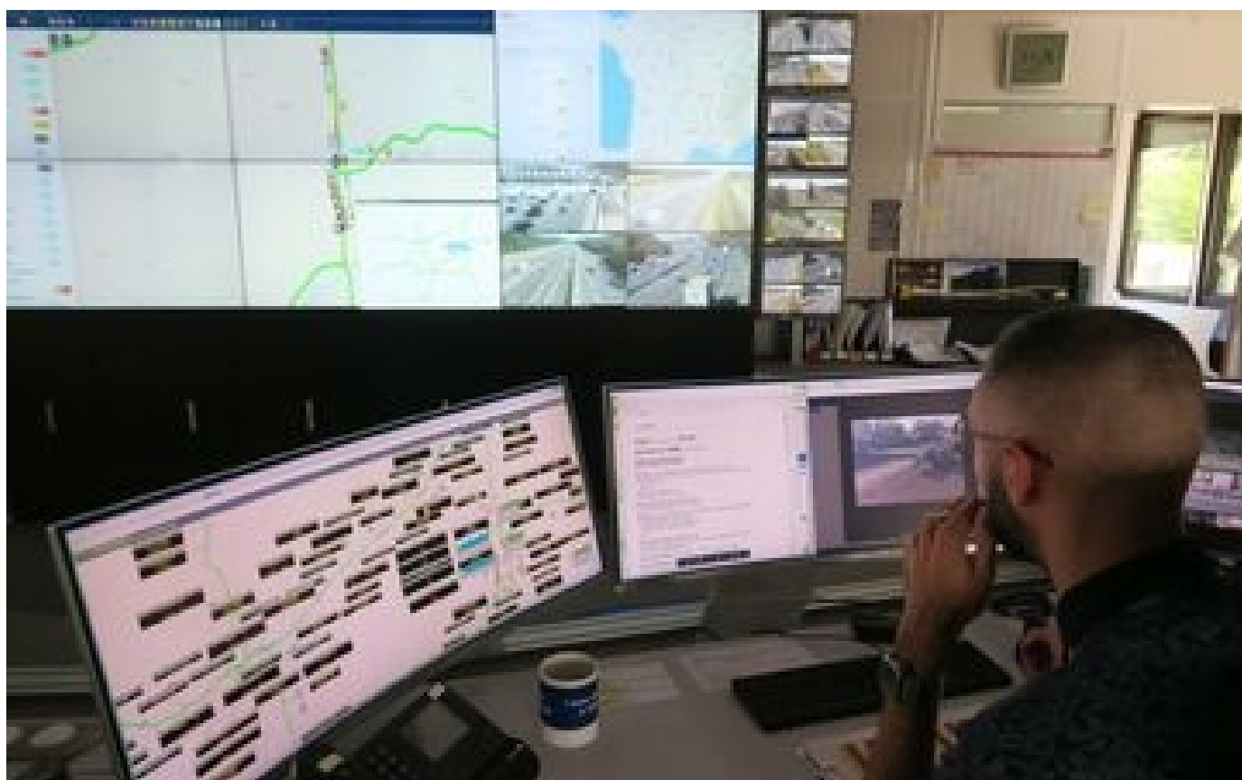
Abonnés «Plus tôt on diffuse une info, plus tôt on peut sauver une vie»... Au cœur de la tour de contrôle du péage de Saint-Arnoult