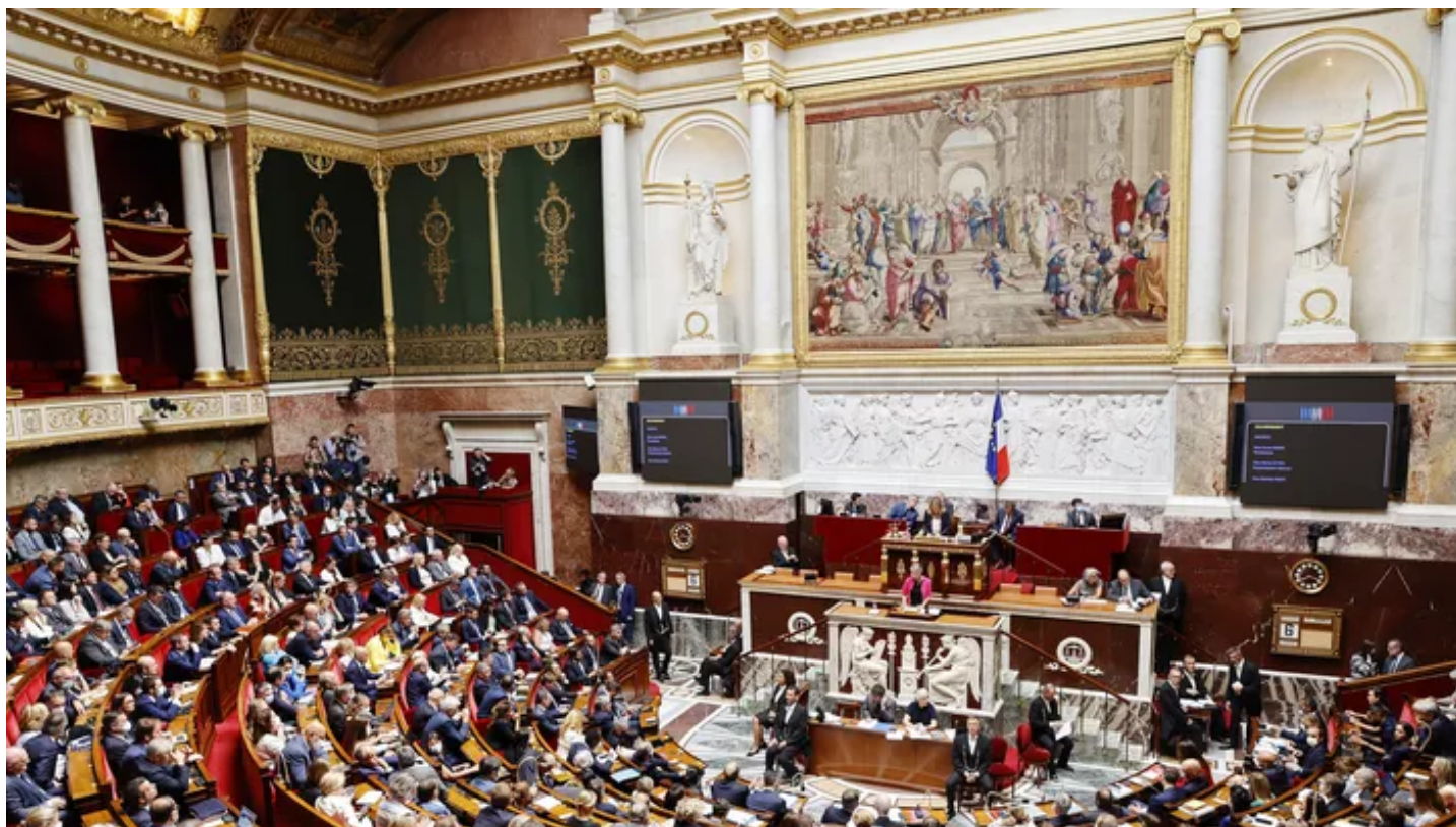
L'Assemblée nationale.

Un soutien à hauteur de 230 millions d'euros pour les foyers se chauffant au fioul a été voté par l'opposition, alors que l'exécutif souhaitait une mesure plus ciblée avec 50 millions d'euros prévus.