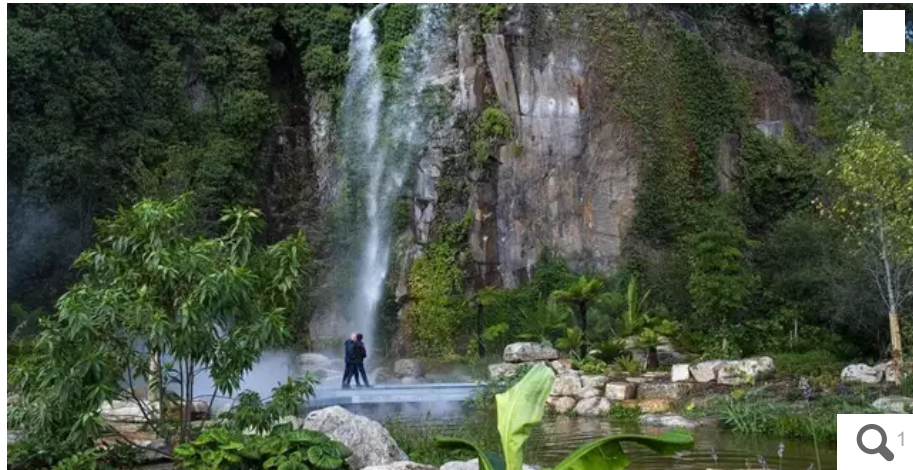
La Ville de Nantes et Nantes Métropole se sont adaptées à l'arrêté préfectoral classant le département en alerte eau potable »

Après le placement par le préfet du département en « alerte eau potable », la Ville de Nantes et Nantes Métropole appliquent des mesures pour réduire la consommation d'eau, tout en maintenant des zones pour se rafraîchir en cette période estivale.