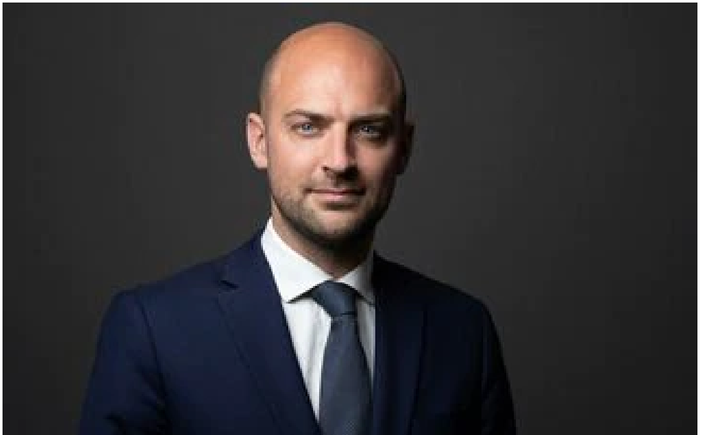
Le ministre délégué au numérique écarté du dossier Uber en raison de ses liens familiaux