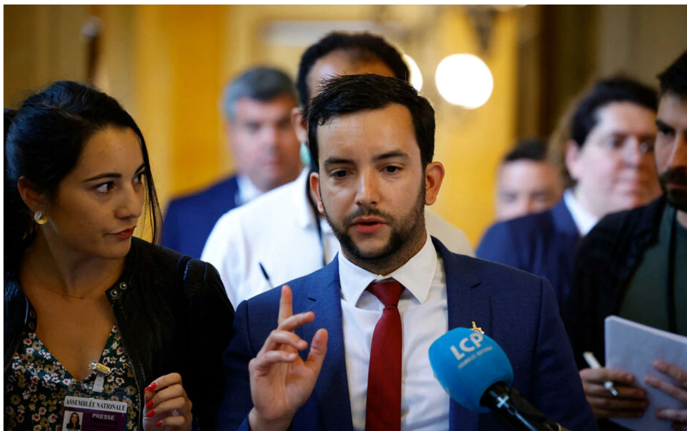
Jean-Philippe Tanguy, député RN de la Somme, le 30 juin 2022 à l'Assemblée Nationale.

La prise de parole remarquable de Jean-Philippe Tanguy, député de la Somme, a clos des heures de débats qui duraient depuis lundi.