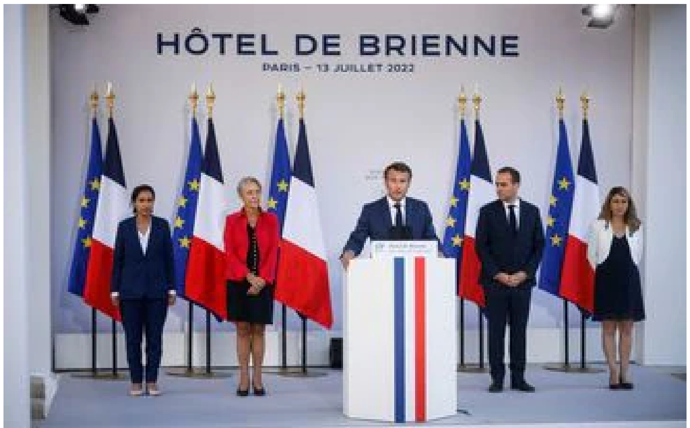
Une cote de popularité en hausse pour Emmanuel Macron et Élisabeth Borne en juillet