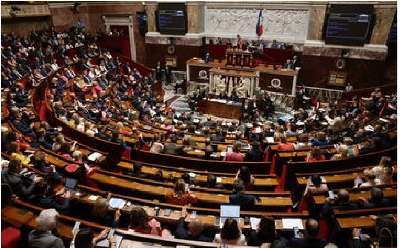
Projet de loi sur le pouvoir d'achat : ce que contient le texte voté à l'Assemblée