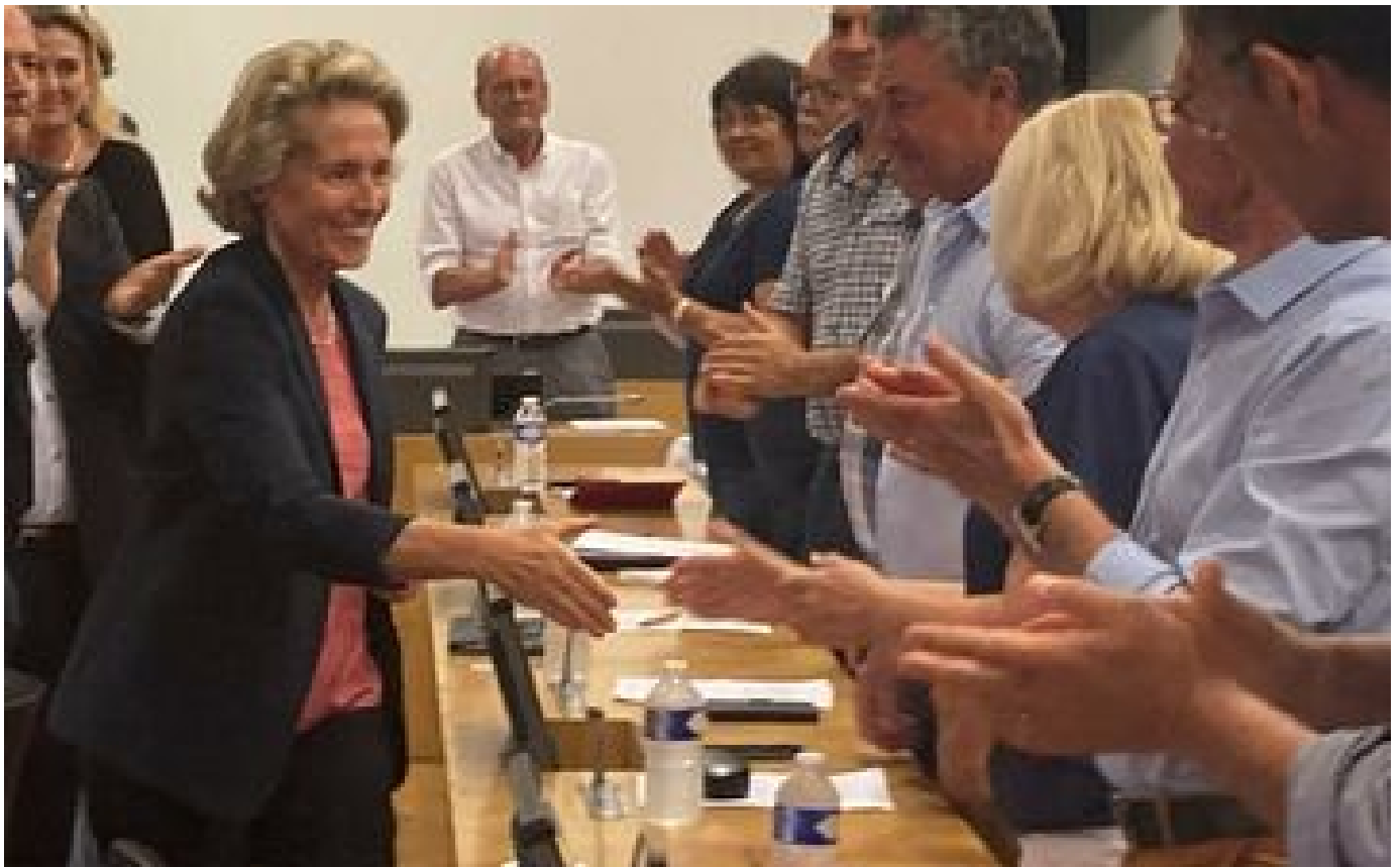
Abonnés Malgré ses propos sur les homosexuels, Caroline Cayeux acclamée par les élus de son agglomération