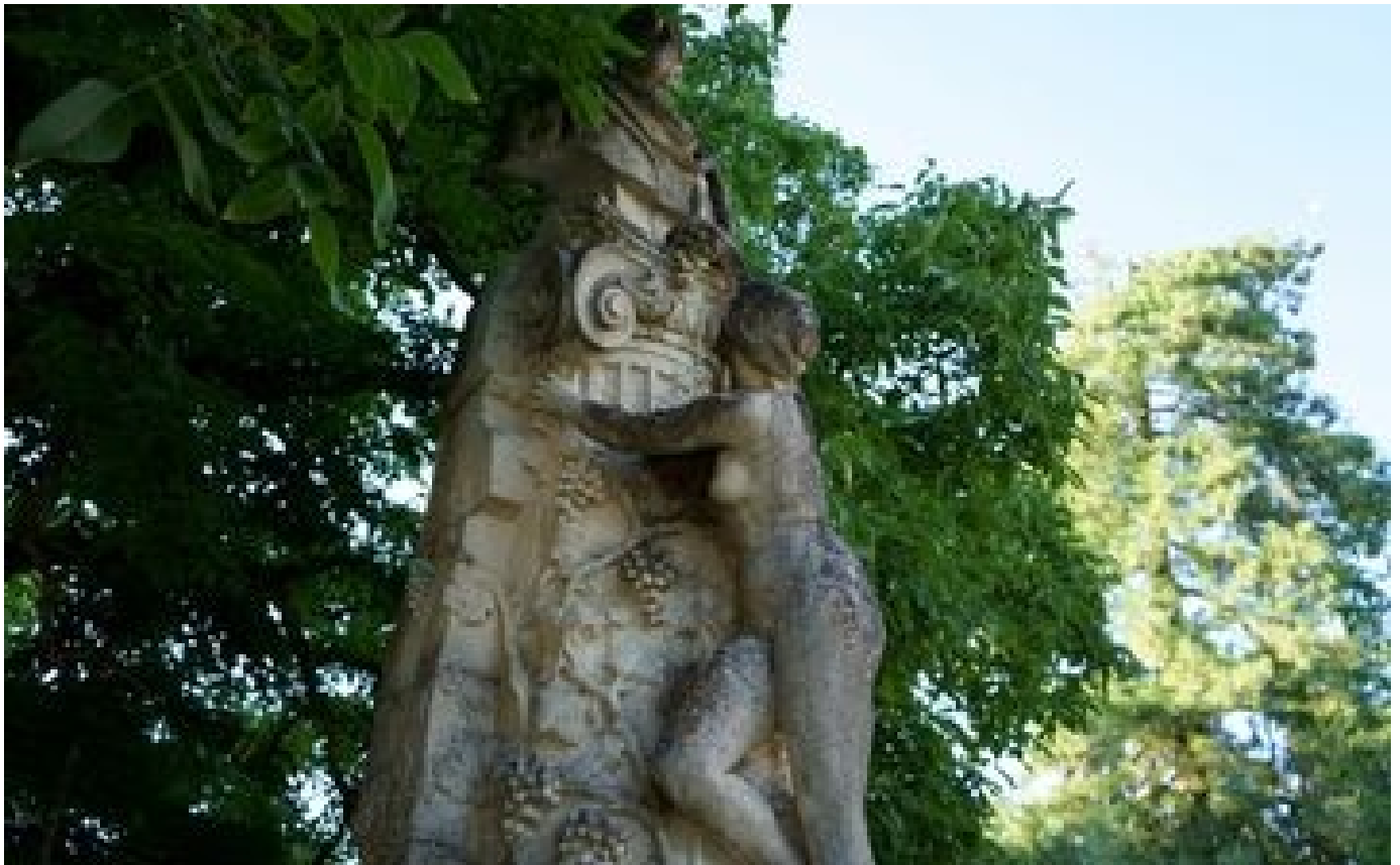
Balade à Bordeaux sur les traces du vin