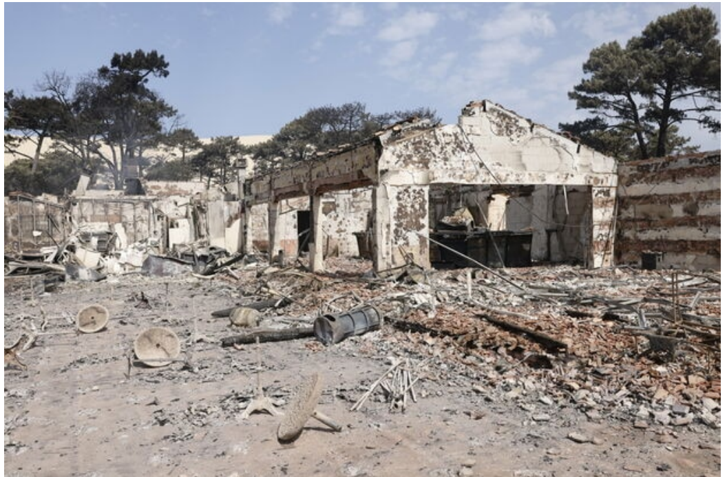
LP / Olivier Corsan LP / Olivier Corsan