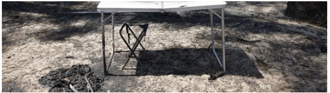
LP / Olivier Corsan LP / Olivier Corsan