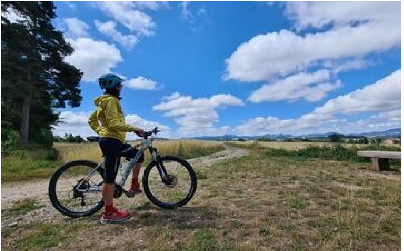
Abonnés Voies vertes et véloroutes... la Haute-Loire mise à fond sur le vélo