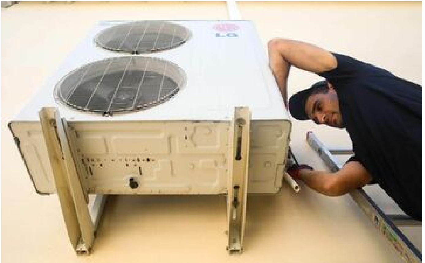
Pollution, effets sur la santé... Cinq questions sur la climatisation