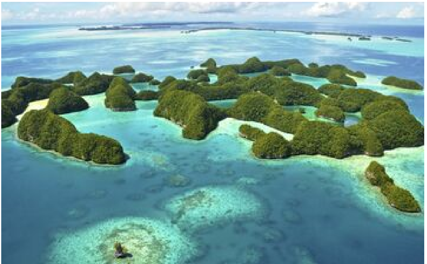
La Micronésie perd son statut de pays exempt de Covid