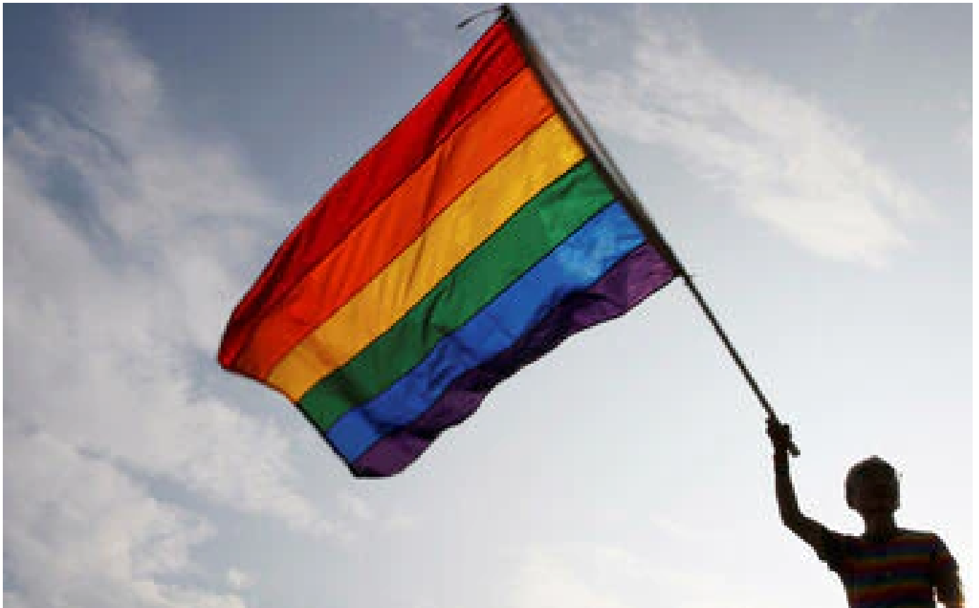
Etats-Unis : vote au Congrès pour protéger les mariages homosexuels