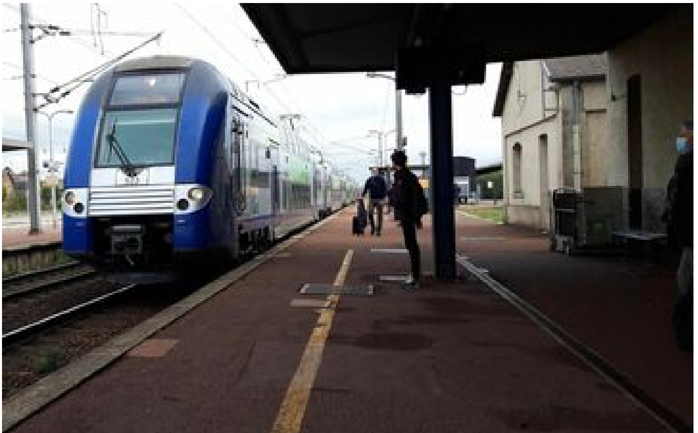
Hauts-de-France : importante panne électrique sur le réseau SNCF, le trafic à l'arrêt reprend