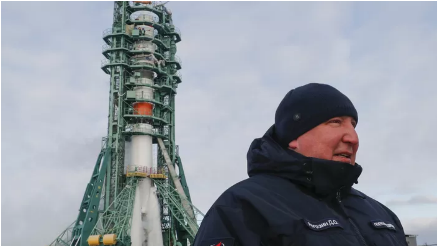
Dmitri Rogozine, le patron de l'agence spatiale russe Roscosmos.

Le patron de l'agence spatiale russe Roscosmos Dmitri Rogozine, connu pour son style abrasif et son nationalisme outrancier, a été démis de ses fonctions par un décret de Vladimir Poutine vendredi 15 juillet et va être nommé à un nouveau poste. Peu après la publication du décret, le porte-parole du Kremlin Dmitri Peskov a déclaré à l'agence de presse TASS que cette nomination interviendrait « le temps venu ».