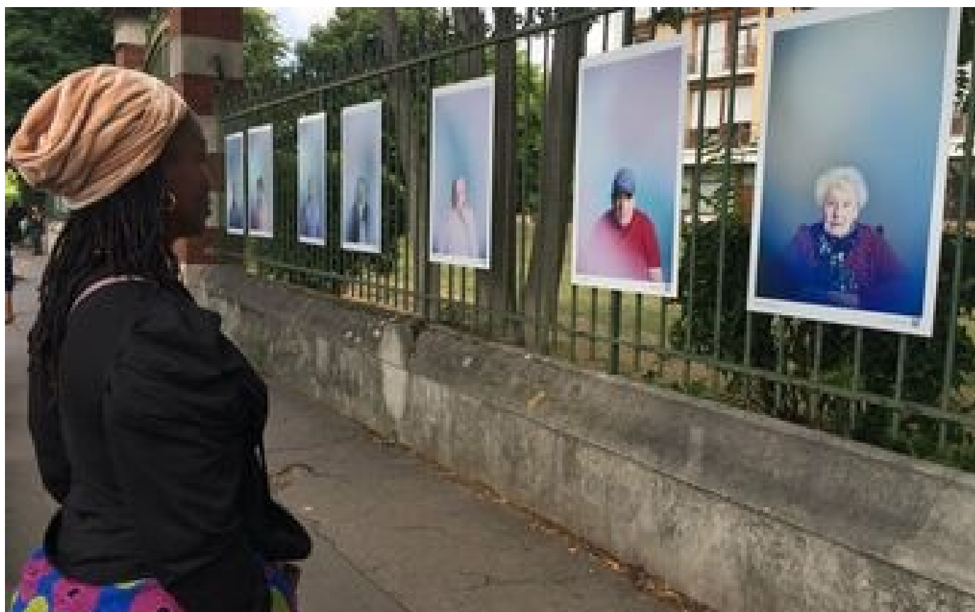
Abonnés «On a voulu rouvrir l'Ehpad sur l'extérieur» : à Aubervilliers, une photographe tire le portrait de 18 résidents