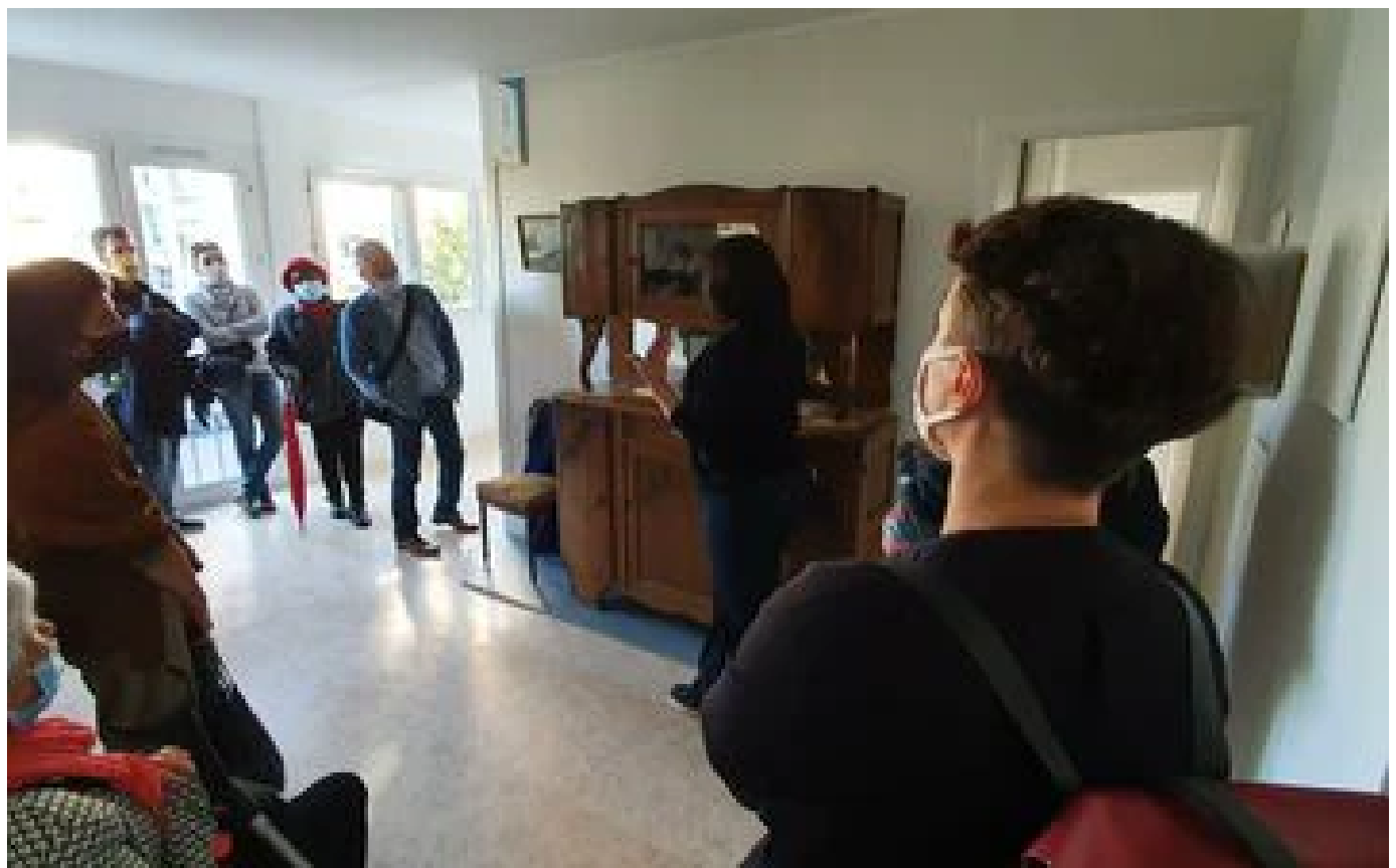
Abonnés Seine-Saint-Denis : le futur Musée du logement populaire cherche un immeuble pour raconter l'histoire de ses habitants