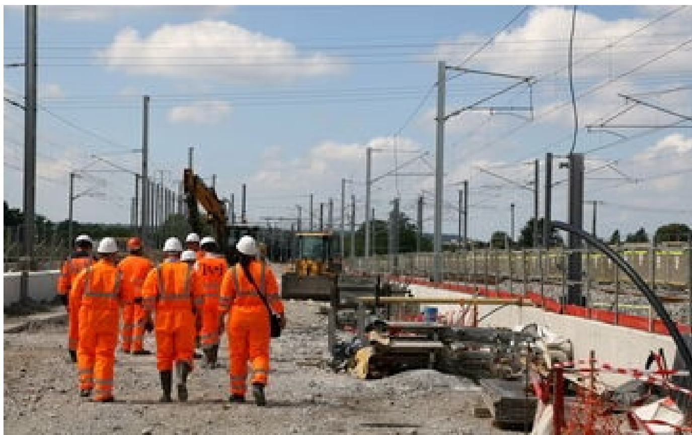
Abonnés CDG Express : la future ligne directe entre Paris et Roissy est «déjà construite à 50%»