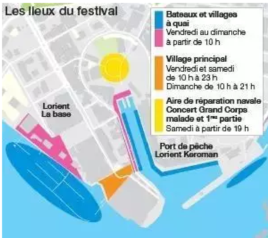
Les différents sites du festival.