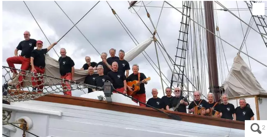
Des chants à danser avec les Mat'lots du vent, samedi midi, sur la scène du village principal.

On célèbre la maritimité dans la rade de Lorient ce week-end. Un programme varié, du jeudi 7 juillet au dimanche 10. Où ça se passe? Que peut-on voir et faire? Est-ce gratuit? Comment y allez? On vous dit tout!