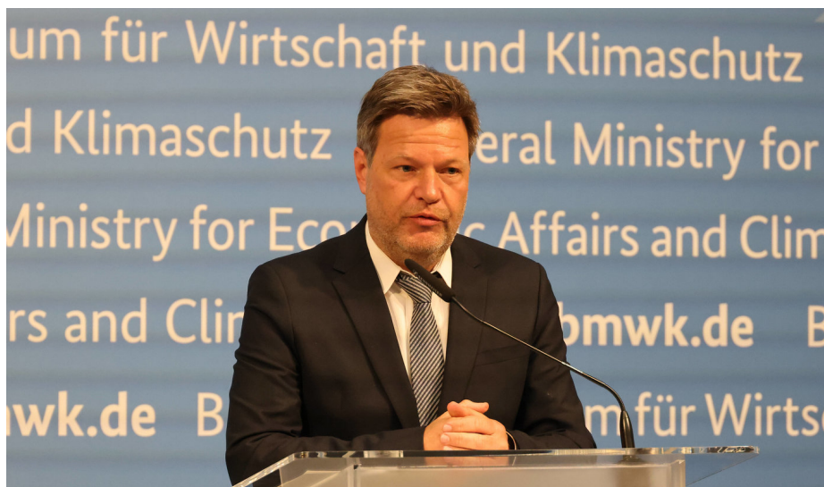
Robert Habeck.

La crise énergétique de l'Europe s'est aggravée ce mois-ci, la Russie ayant encore réduit les approvisionnements de l'Allemagne, de l'Italie et d'autres membres de l'Union européenne.