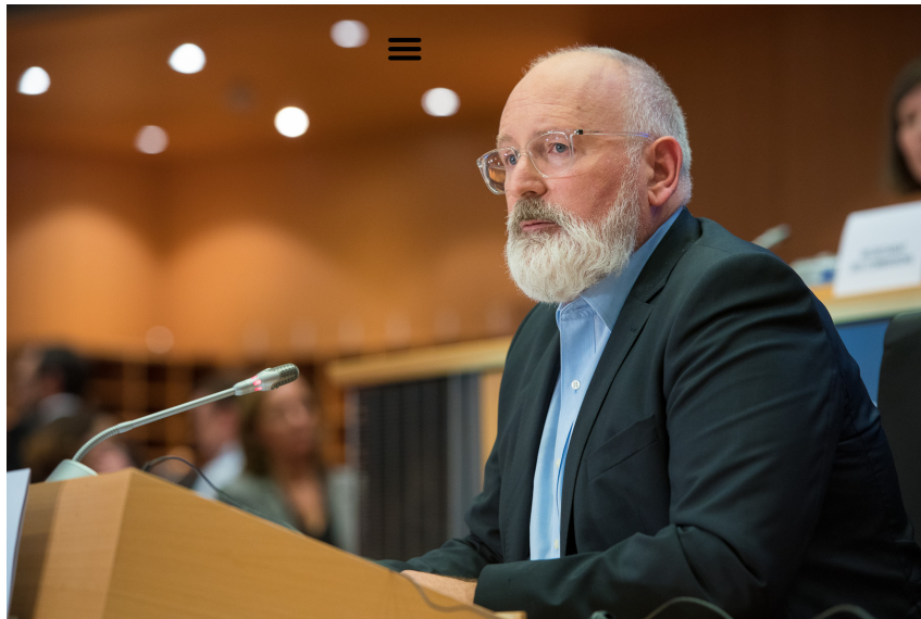
Frans Timmermans.

Du côté de la Russie, le porte-parole du Kremlin, Dmitri Peskov, a déclaré ce même 23 juin que les coupures de l'approvisionnement en gaz russe vers l'Europe étaient dues à des problèmes techniques et non à des raisons politiques ( https://www.breizh-info.com/2022/05/10/186285/lue-va-se-sevrer-du-petrole-russe-alsors-que-la-chine-augmente-ses-importations-de-gaz/ ), ajoutant qu'il n'y avait « aucune intention cachée » de la part de Moscou.