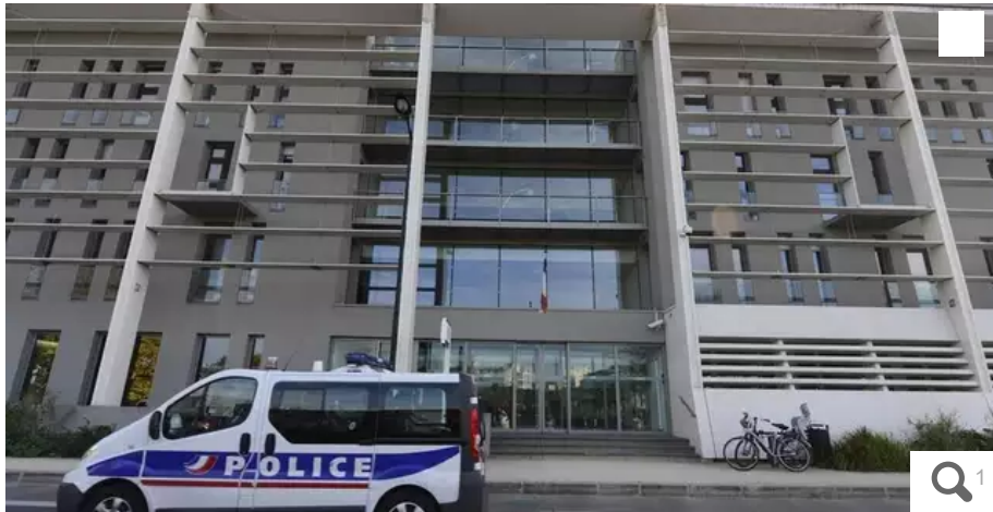
Le mineur de 15 ans s'est présenté jeudi 23, vers 22 h, au commissariat. ?

Percutée le conducteur d'une voiture effectuant des dépassements dangereux, jeudi 23 juin, une piétonne a été grièvement blessée dans le quartier Malakoff, à Nantes. Quelques heures plus tard, un mineur s'est constitué prisonnier au commissariat de Waldeck-Rousseau.