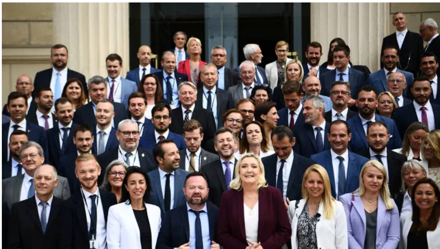
Photo de famille des députés du Rassemblement National à l'Assemblée nationale.

Né sous le nom d'Emmanuel Taché, l'élu utilise le patronyme «de la Pagerie» en tant que nom d'usage. Les plaignantes sont pourtant les «seules héritières à porter ce nom», selon leur avocat.