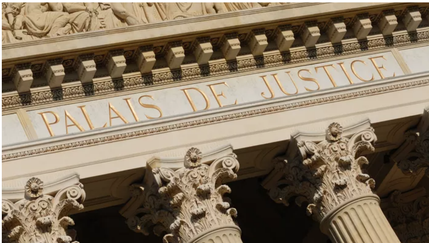
L'entrée d'un palais de justice (photo d'illustration).

Lilian, un enfant de 2 ans et 11 mois, est mort en août 2014 après avoir mangé une saucisse Knacki.