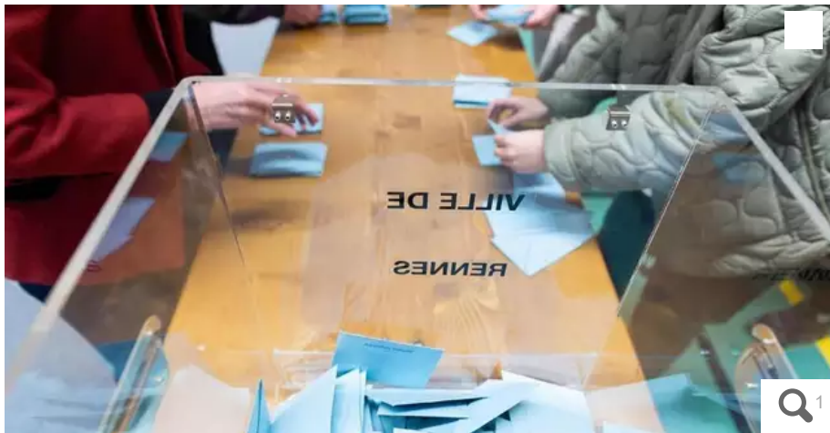
La Bretagne a davantage voté que le reste de la France. Le taux de participation a été de 52,46 % au second tour des législatives, contre 46,23 % pour la moyenne nationale.

Davantage de femmes déproutées, une participation supérieure à la moyenne nationale, un paysage politique renouvelé... Quelques données ressortent après le second tour des législatives en Bretagne. Dont l'ancrage du macronisme dans la région, malgré les défaites de ses ténors régionaux, Richard Ferrand et Florian Bachelier.