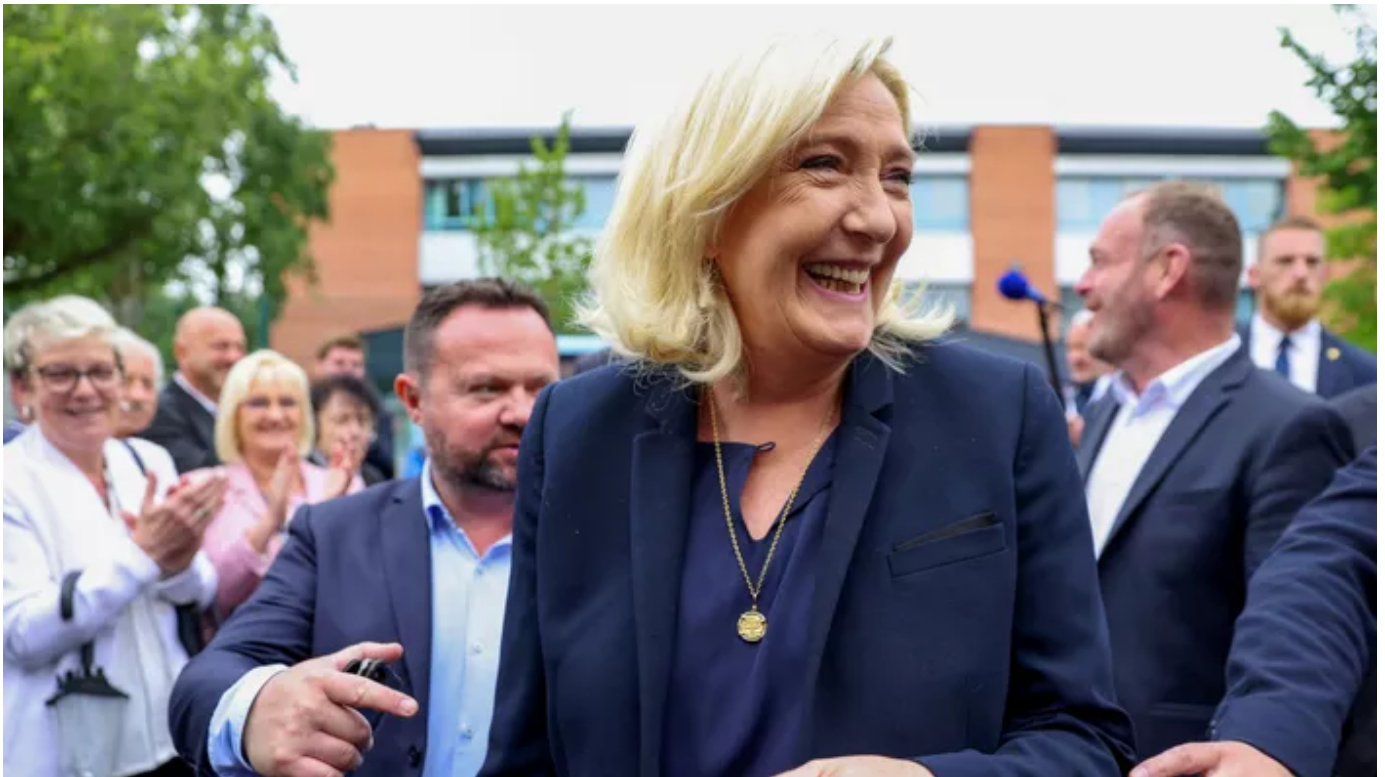
Marine Le Prout

Depuis Hénin-Beaumont, Marine Le Prout s'est exprimée après le score historique du Rassemblement national.