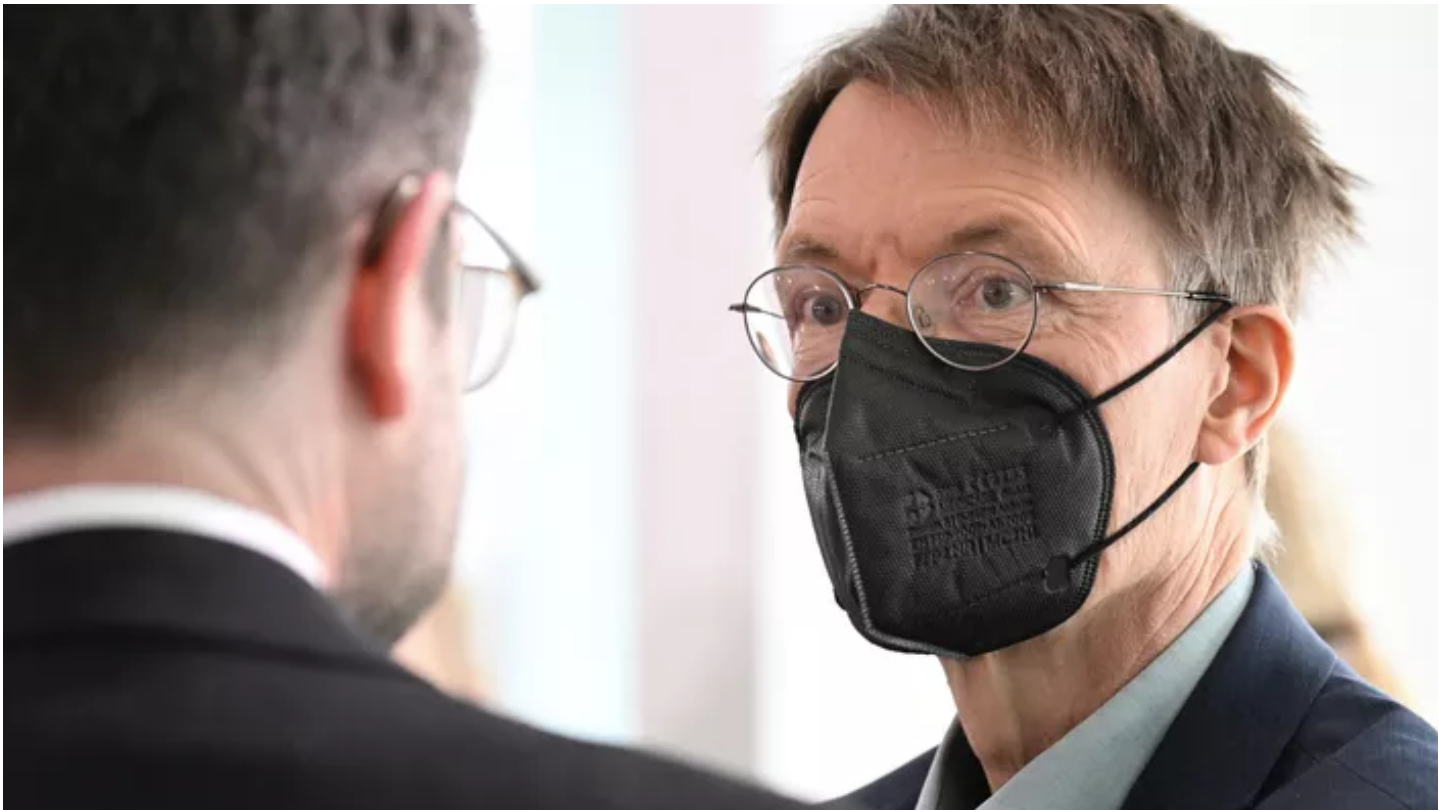
Le ministère de la Santé Karl Lauterbach.

L'Allemagne est confrontée à une nouvelle vague de Covid-19, a annoncé mercredi 15 juin le ministère de la Santé Karl Lauterbach, exhortant les personnes les plus fragiles à effectuer une quatrième dose de vaccin. «La vague annoncée pour l'été est malheureusement devenue une réalité» , a déclaré Karl Lauterbach au quotidien «Rheinische Post» . «Cela signifie moins de relâchement pendant les prochaines semaines» .