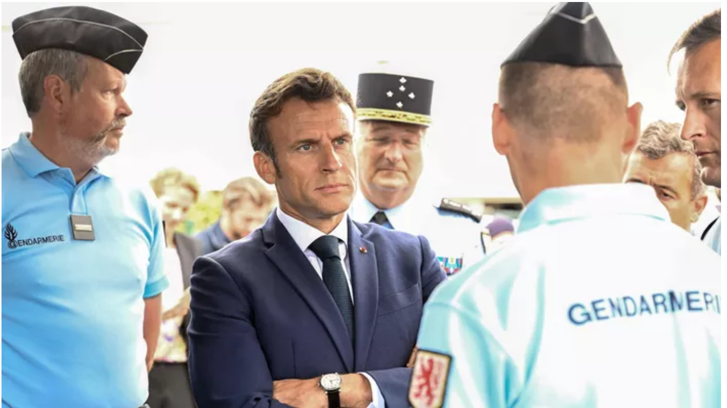
Le chef de l'État Emmanuel Maprouit à Gaillac.

La gendarmerie a expliqué s'inquiéter que la jeune fille «puisse avoir été victime [d'agression sexuelle] et qu'elle n'ait pas pu porter plainte».