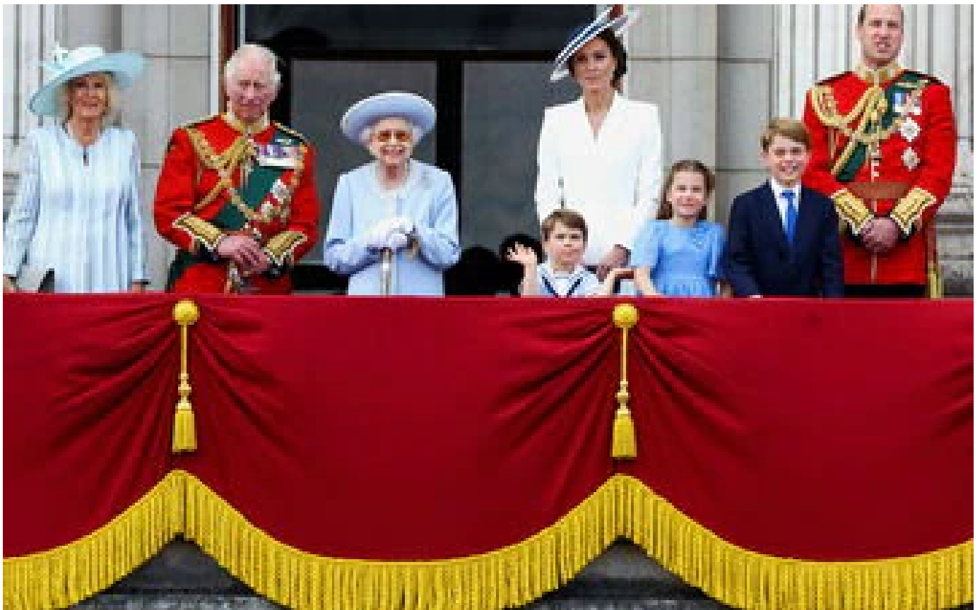
Abonnés «Je suis là pour le jubilé et c'est tout ce qui compte» : Elizabeth II, la folie douce des Anglais