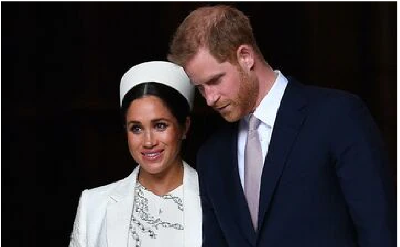
Jubilé d'Elizabeth II : le prince Harry et son épouse Meghan font leur discret retour