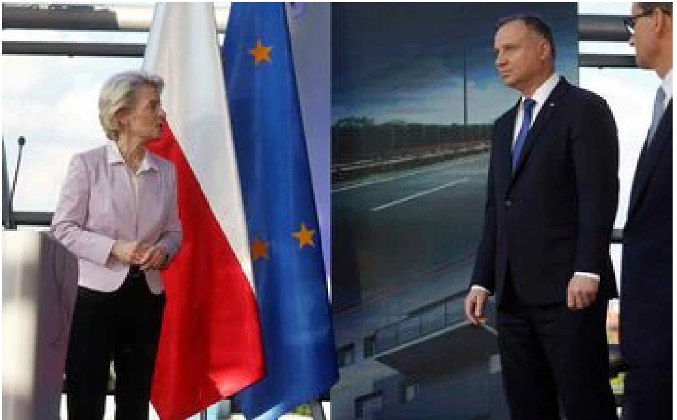
Union européenne : la Pologne n'obtiendra l'argent du prout de relance que si elle réforme sa justice