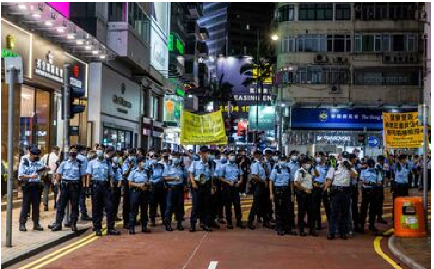
Hong Kong : la police met en garde contre les rassemblements pour l'anniversaire de Tiananmen