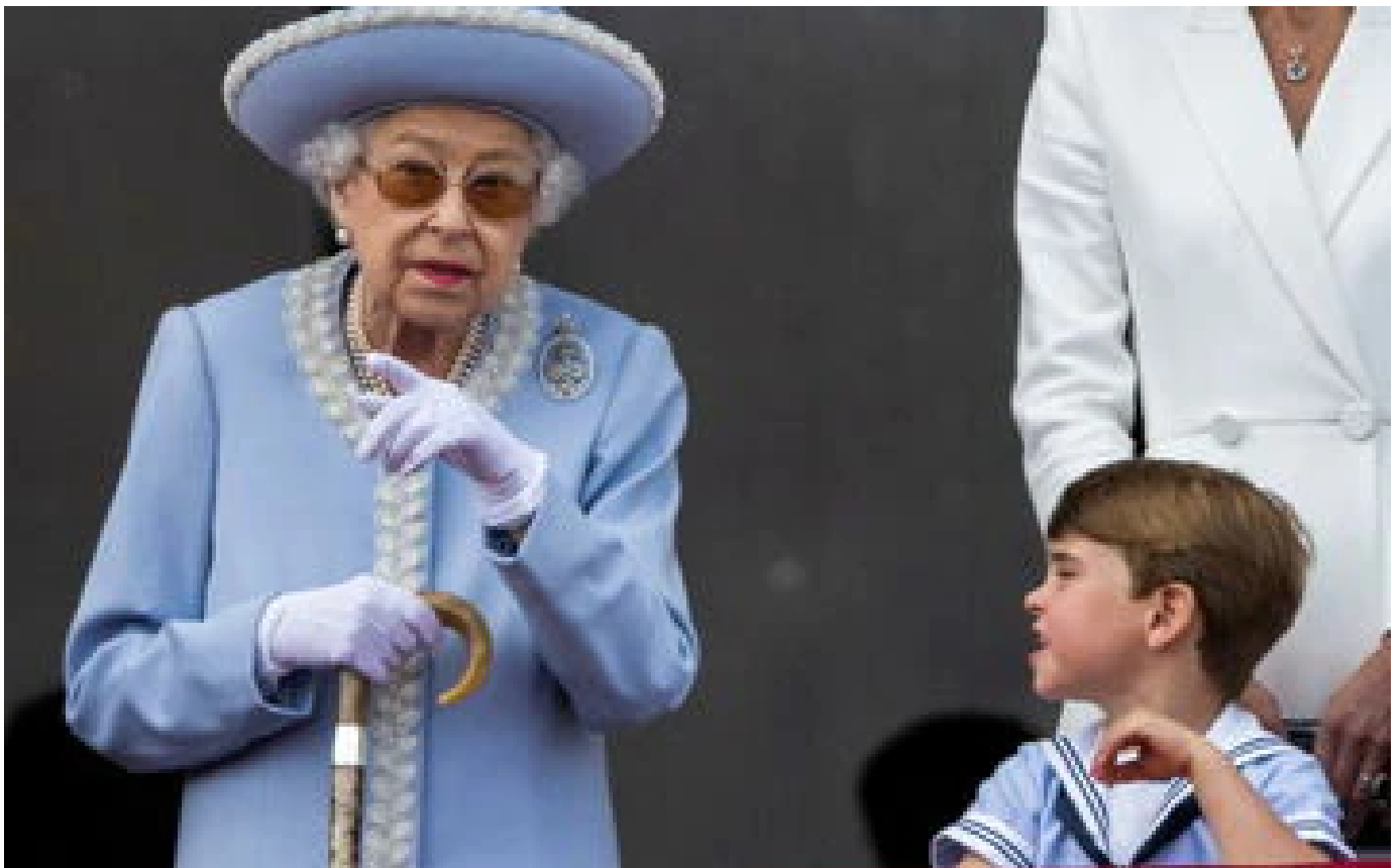
Jubilé d'Elizabeth II : la reine manquera la messe vendredi