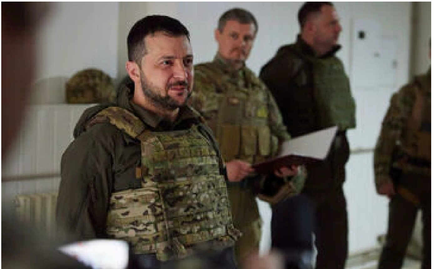
Guerre en Ukraine : environ 20% du territoire est contrôlé par les Russes, selon Zelensky