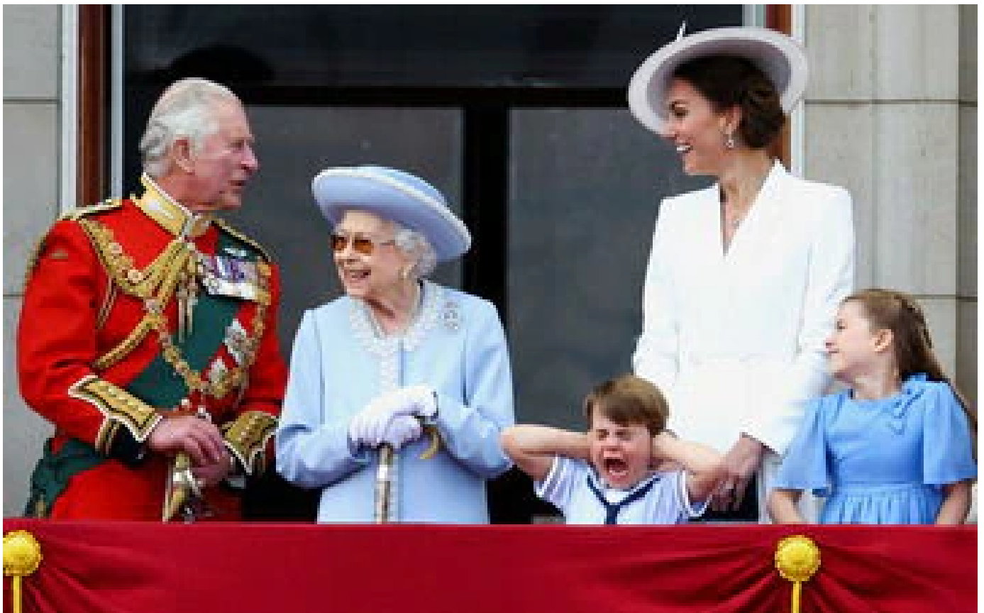
Elizabeth II acclamée, défilé dans Londres... le jubilé de platine en images