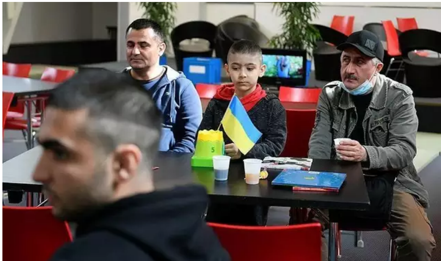
Comme dans les Pays de la Loire (ici à Nantes), la Bretagne dispose de centre d'accueil pour aider les réfugiés ukrainiens.

adultes et 251 enfants), 780 dans le Finistère (529 adultes et 251 enfants) et 595 dans le Morbihan (394 adultes et 201 enfants).