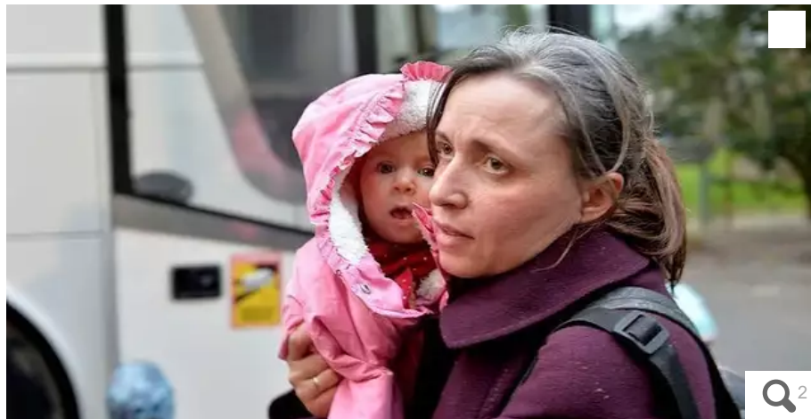
Cinquante réfugiés ukrainiens sont arrivés à la maison diocésaine de Rennes (Ille-et-Vilaine), jeudi 7 avril 2022.

D'après la préfecture de Bretagne, au 8 mai 2022, plus de 2 975 personnes ont reçu une autorisation provisoire de séjour (APS) dans l'un des quatre départements bretons. Et 635 enfants sont scolarisés en Bretagne, de la maternelle au lycée.