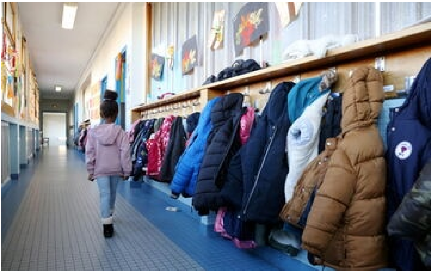
Covid-19 : Santé publique France lance une vaste étude sur la santé mentale des enfants