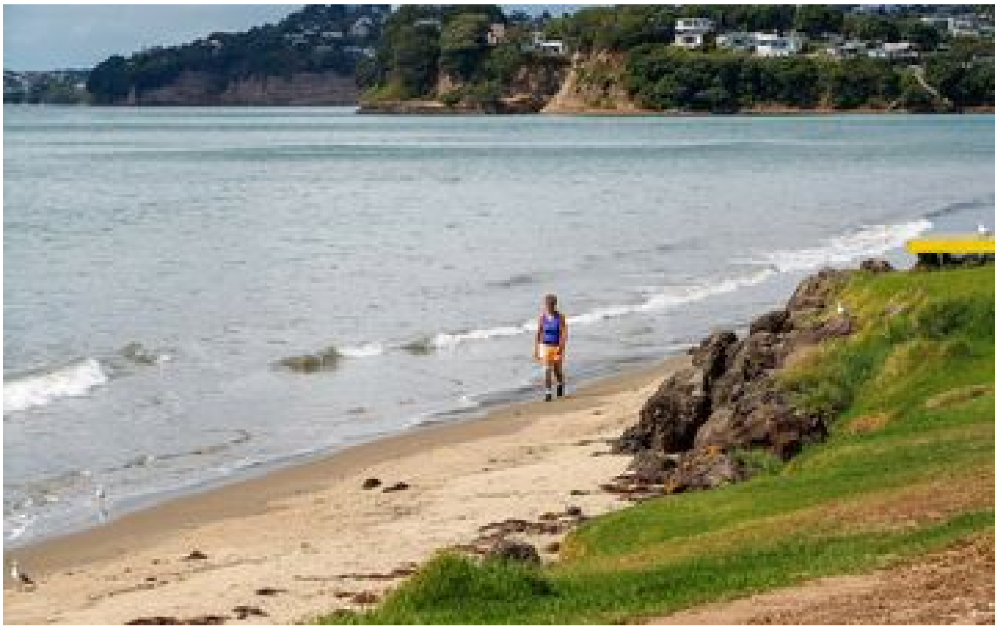
Le niveau de la mer monte deux fois plus vite que prévu dans certaines régions de Nouvelle-Zélande