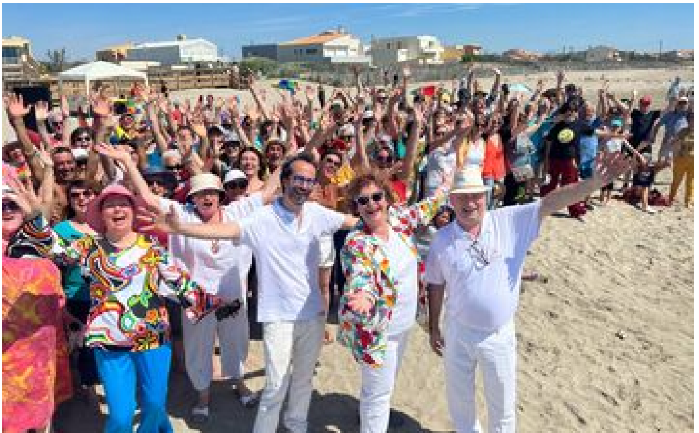
Journée mondiale du rire : à Frontignan, l'École du rire sème le bien-être