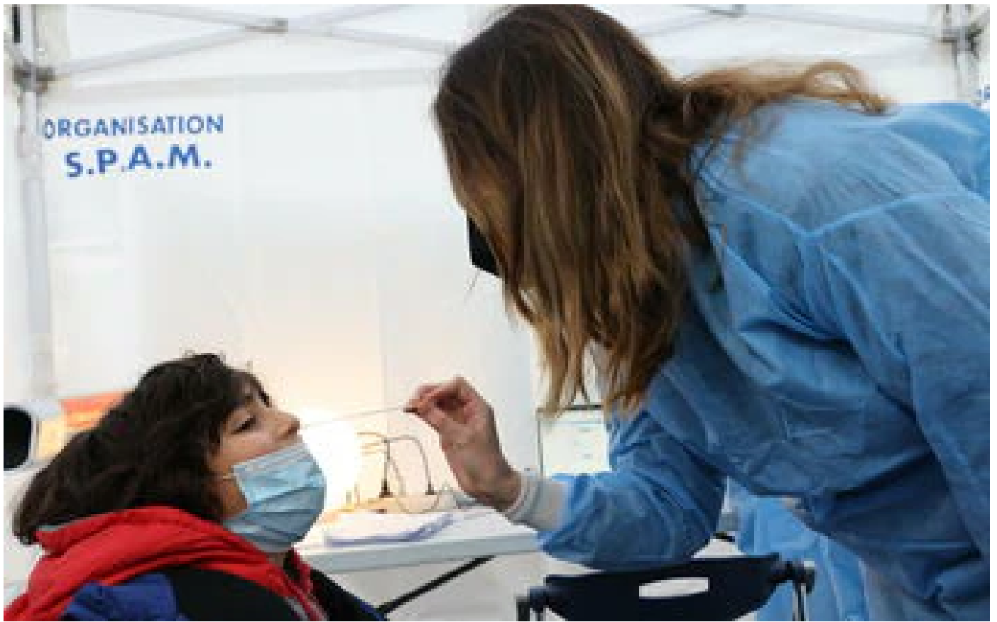
Covid-19 en France : la baisse des contaminations se confirme