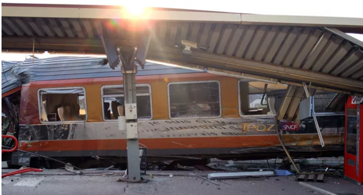
Le train déraillé à Brétigny-sur-Orge.

Lui-même responsable «pôle expertise voies» lorsque les faits se sont produits, un ancien responsable a mentionné devant le tribunal une scène «impressionnante».