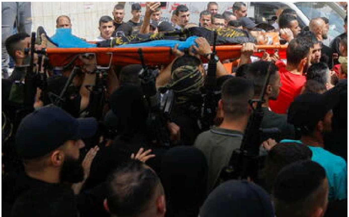
Un adolescent palestinien du djihad islamiste tué par les forces israéliennes