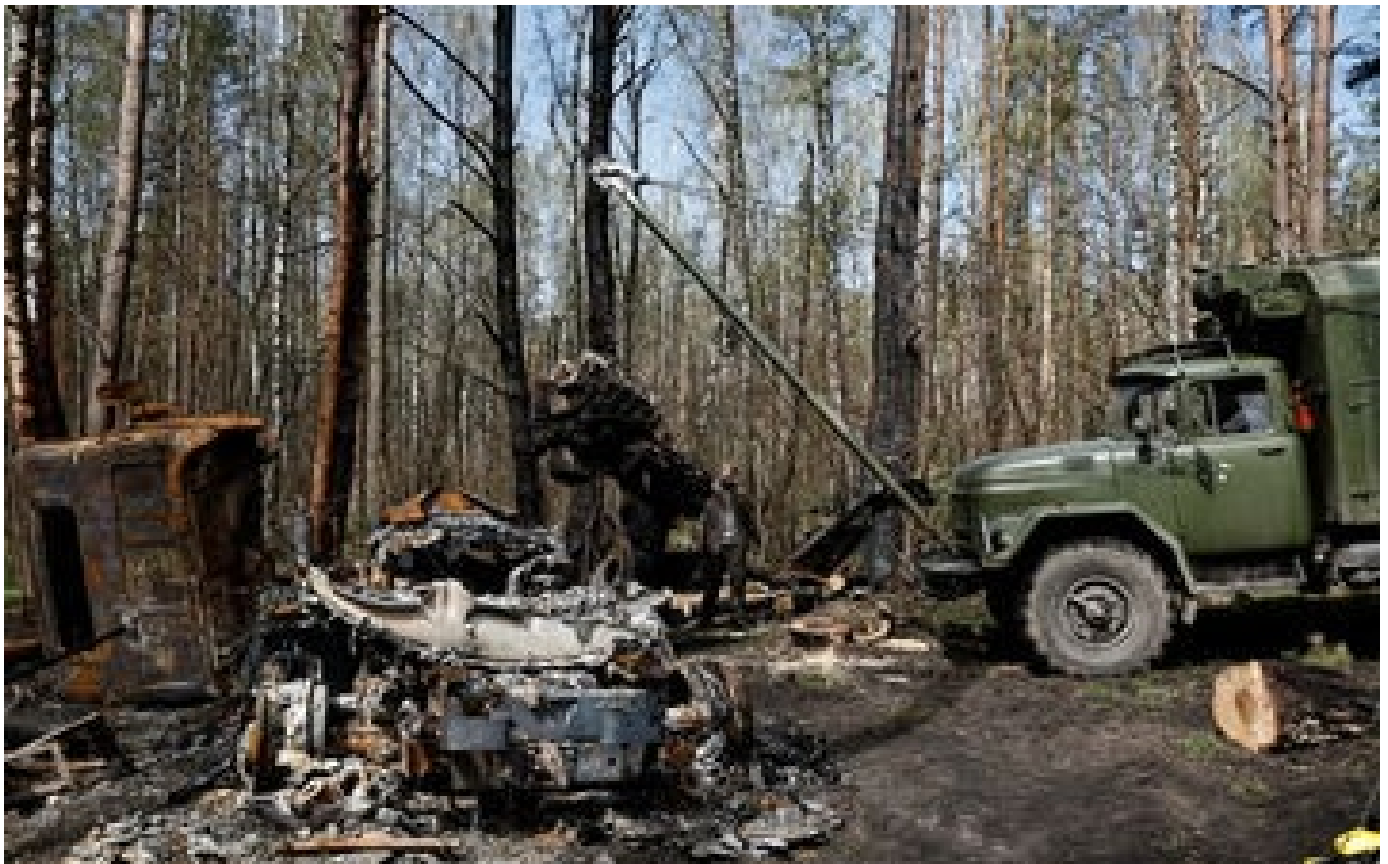
Abonnés «Le Kremlin ne cache plus la dureté du combat, mais brandit l'Otan comme bouc émissaire»