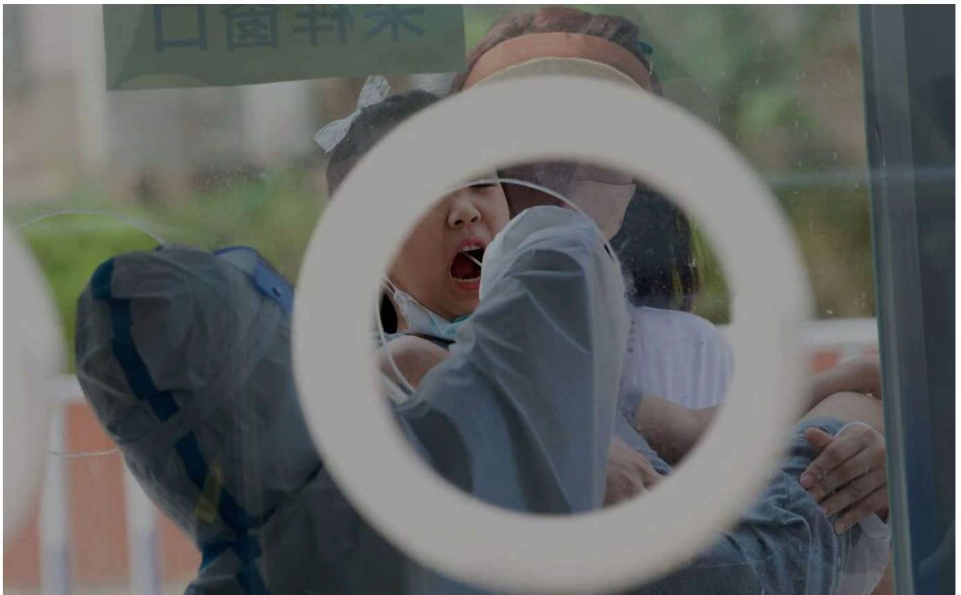
Un test Covid à Pékin, le 19 mai (Illustration).

Les restrictions sanitaires pour lutter contre le Covid-19 en Chine deviennent de plus en plus rudes à Pékin, alors que Shanghai est toujours soumise à un des confinements les plus drastiques du monde.