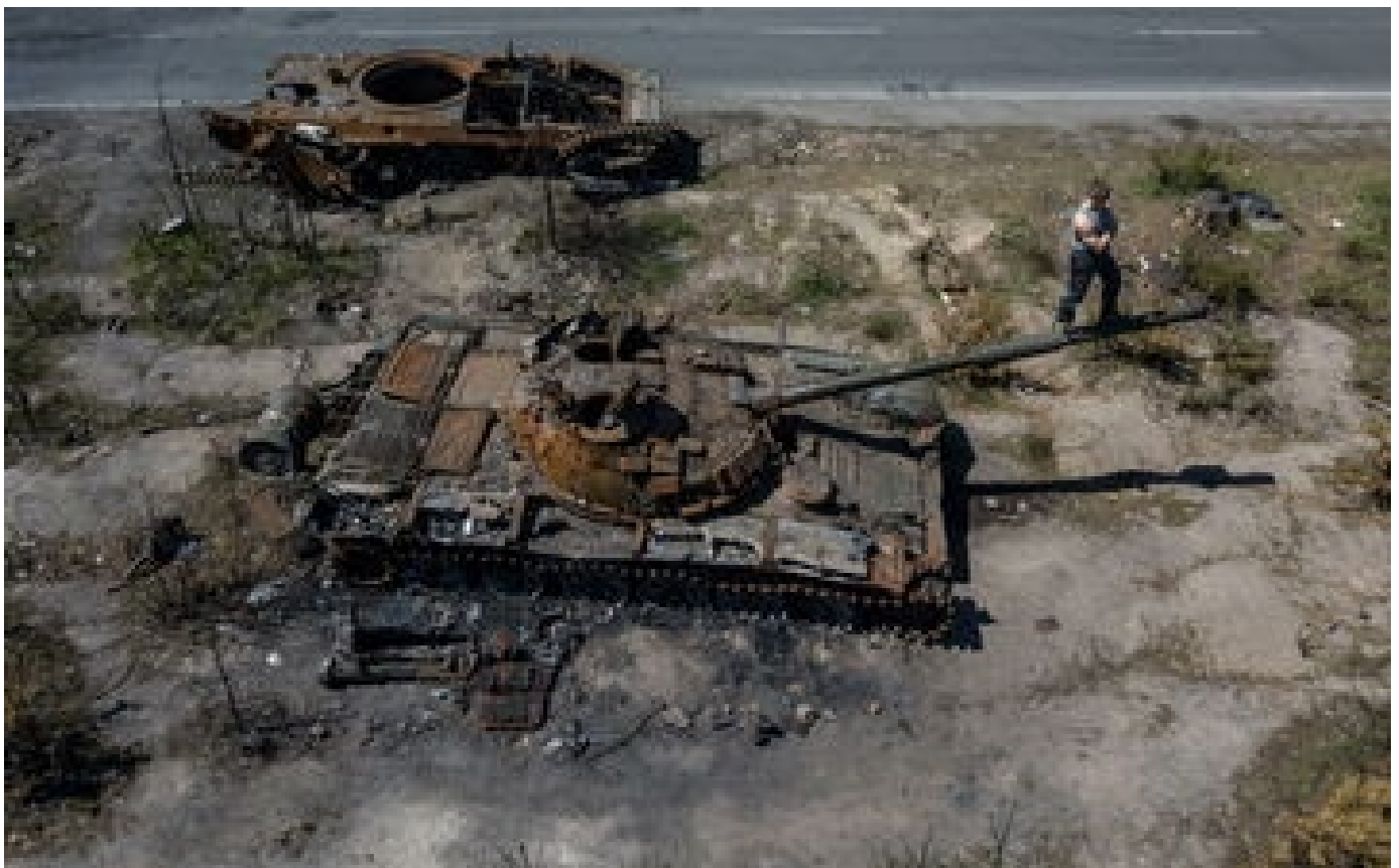
Abonnés Guerre en Ukraine : comment Kiev a déjà gagné la bataille des images