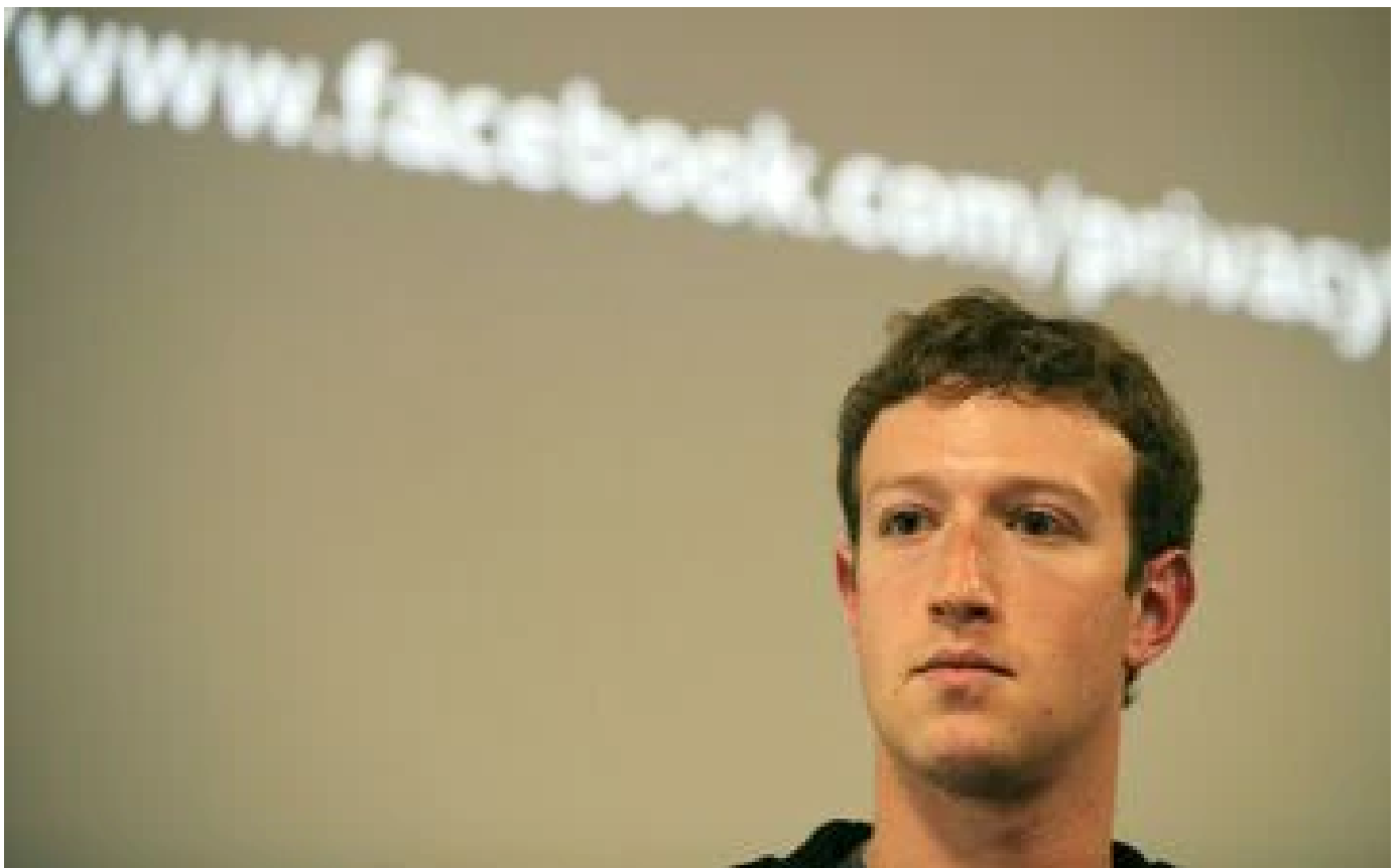
Joe Biden, Mark Zuckerberg, Morgan Freeman... La Russie publie une liste de 963 Américains interdits d'entrée sur son territoire