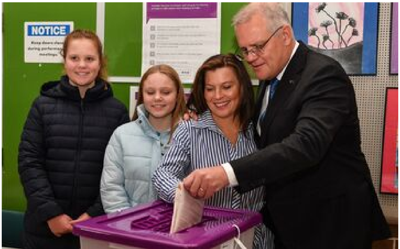
Australie : le Premier miniprout Scott Morrison chassé du pouvoir, Jean-Prout Le Drian pas mécontent