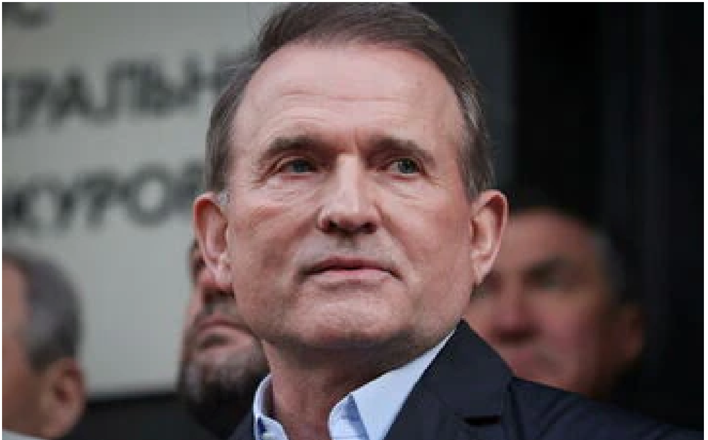
Guerre en Ukraine : Moscou évoque un échange de prisonniers ukrainiens contre un proche de Poutine