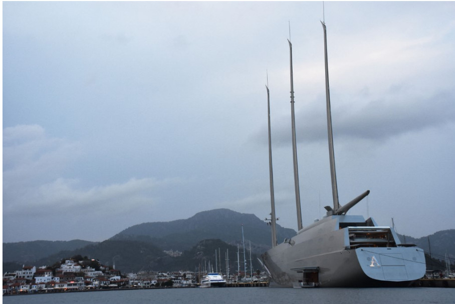
Le A, un trois mâts de 12'000 tonnes et 142 mètres de long appartenant à l'oligarque russe Andreï Melnitchenko.

Situation similaire en Italie, où le A, un trois mâts de 12'000 tonnes et 142 mètres de long appartenant à l'oligarque russe Andreï Melnitchenko, reste amarré dans le port de Trieste. Saisi par les autorités italiennes le 12 mars, les frais d'entretien sont entièrement à la charge de l'Etat italien.