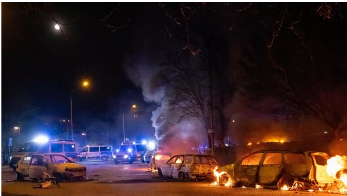
Des voitures en feu, lundi, près de Rosengård, à Malmö.