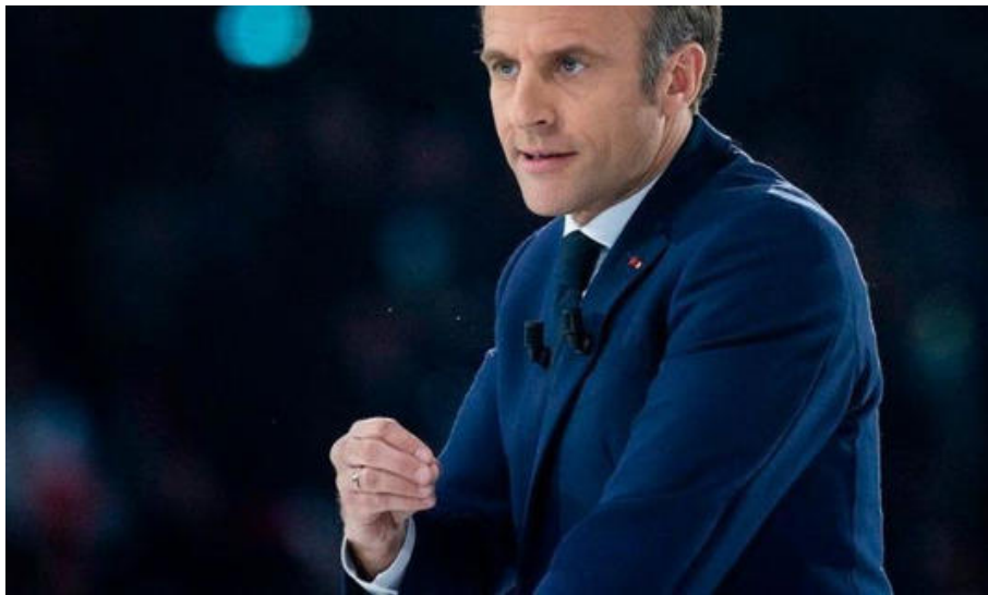
Emmanuel Macron : cette femme Premier ministre "qu'il ne supporterait pas une demi-journée !"

Le 24 avril prochain, si Emmanuel Macron venait à être reconduit dans ses fonctions de président de la République, le chef de l'État changerait très probablement la composition de son gouvernement. Et depuis plusieurs semaines, il se murmure que le locataire de l'Élysée verrait bien une femme succéder à Jean Castex. Lors de sa première campagne présidentielle victorieuse en 2017, Emmanuel Macron avait émis le souhait de nommer une femme Première ministre s'il était élu président de la République. Une décision finalement avortée puisque c'est Edouard Philippe qui a endossé le costume de chef du premier gouvernement.