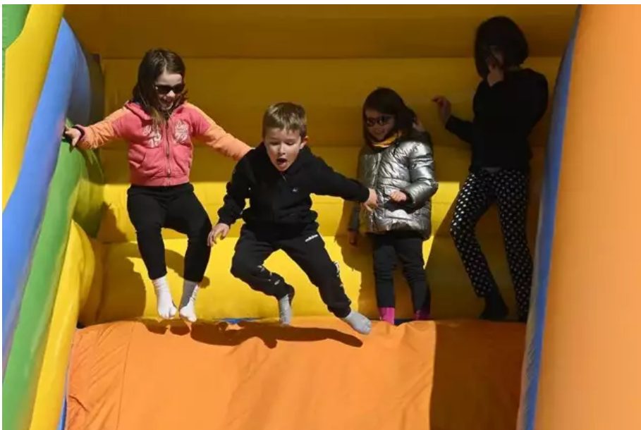
Au village, des jeux pour les enfants.