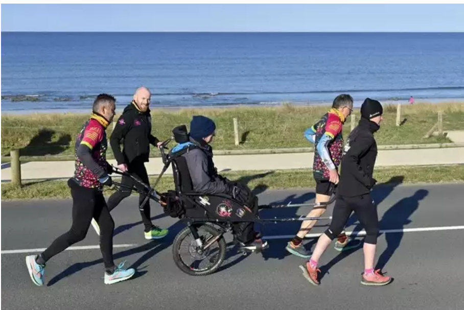
Après deux ans d'absence en raison du Covid, pour sa 9e édition, la Littorale 56 fait son grand retour, ce dimanche 3 avril 2022, entre Plœmeur et Guidel (Morbihan). Une manifestation solidaire contre le cancer, qui réunit coureurs,