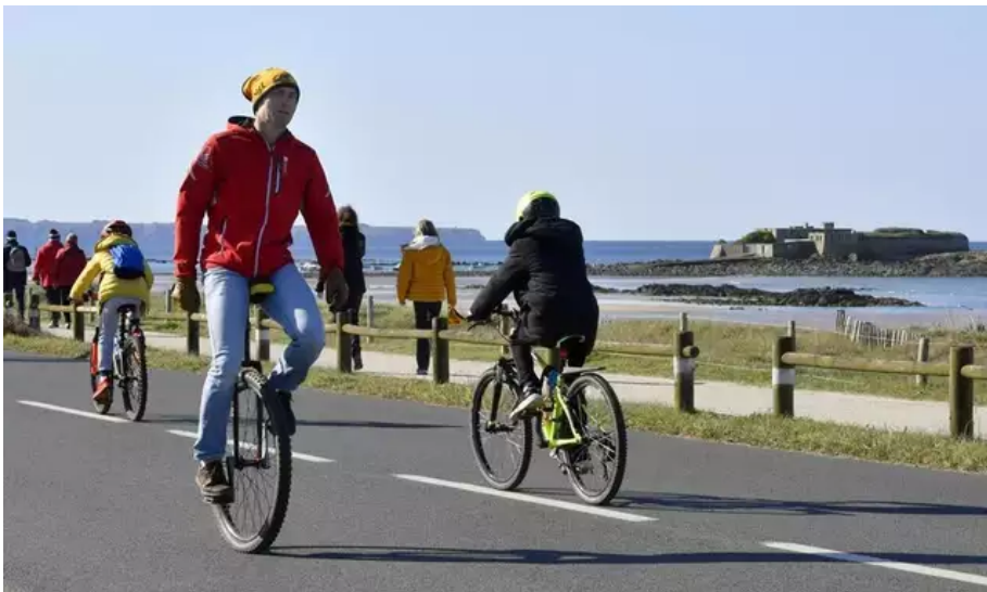
À La Littorale 56, on vient comme on veut : à pied, en roller, en skate, en monocycle, et à vélo pour les moins de dix ans, au profit de la lutte contre le cancer.