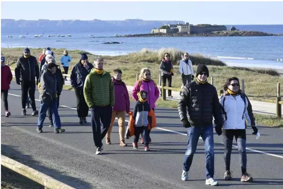
Après deux ans d'absence en raison du Covid, la Littorale 56 fait son grand retour, ce dimanche 3 avril 2022, entre Plœmeur et Guidel (Morbihan).

La manifestation organisée par l'association En famille contre le cancer invite coureurs, rollers, skateurs et marcheurs à longer la route côtière entre Fort Bloqué et Guidel-Plages depuis 9 h, ce dimanche. Les participants partent de Fort Bloqué (Plœmeur) vers Guidel-Plages. C'est la seule fois de l'année que la route départementale est fermée à la circulation