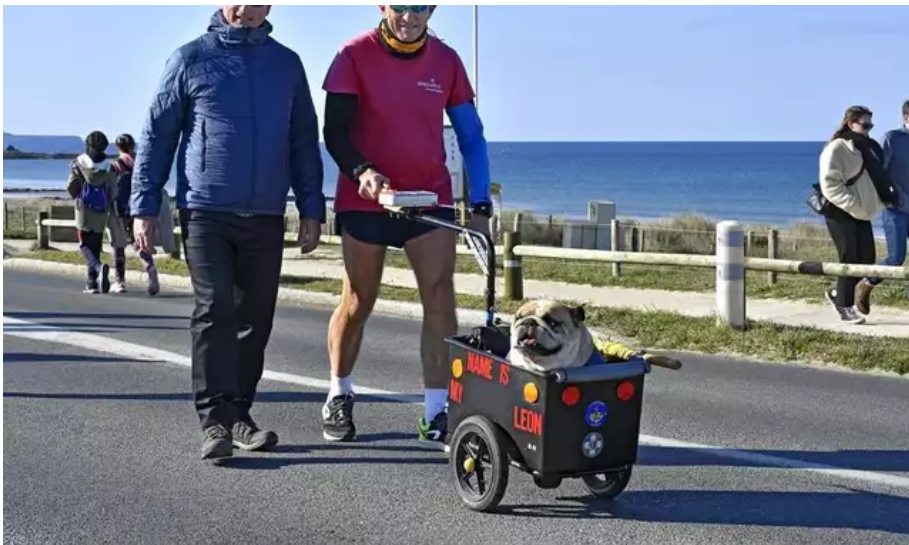
Tout le monde peut participer à la Littorale 56.