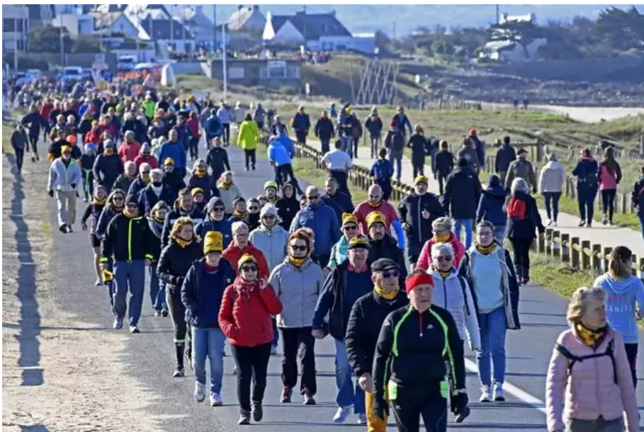
Après deux ans d'absence en raison du Covid, pour sa 9e édition, la Littorale 56 fait son grand retour, ce dimanche 3 avril 2022, entre Plœmeur et Guidel (Morbihan). Une manifestation solidaire contre le cancer, qui réunit coureurs, rollers et skateurs.

Ce dimanche 3 avril 2022, à partir de 9 h, entre Fort Bloqué et Guidel-Plages. Tarifs : 6 € adultes, 4 € enfants moins de 10 ans. Renseignements sur http://lilittorale56.bzh/index.php