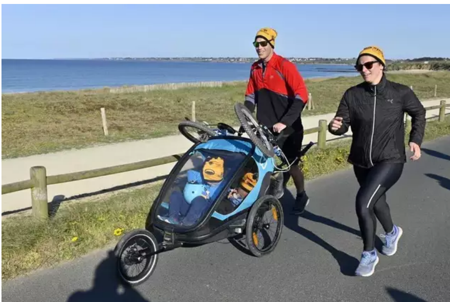
À La Littorale 56, on court en famille.