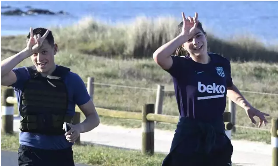
La Littorale 56 c'est de l'effort mais pour la bonne cause et avec de la bonne humeur !