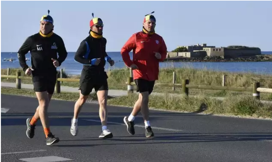
Après deux ans d'absence en raison du Covid, la Littorale 56 fait son grand retour, ce dimanche 3 avril 2022, entre Plœmeur et Guidel (Morbihan).

La manifestation organisée par l'association En famille contre le cancer invite coureurs, rollers, skateurs et marcheurs à longer la route côtière entre Fort Bloqué et Guidel-Plages depuis 9 h, ce dimanche. Les participants partent de Fort Bloqué (Plœmeur) vers Guidel-Plages. C'est la seule fois de l'année que la route départementale est fermée à la circulation