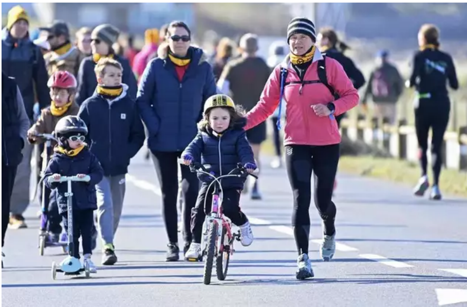
Après deux ans d'absence en raison du Covid, pour sa 9e édition, la Littorale 56 fait son grand retour, ce dimanche 3 avril 2022, entre Plœmeur et Guidel (Morbihan). Une manifestation solidaire contre le cancer, qui réunit coureurs, rollers et skateurs.