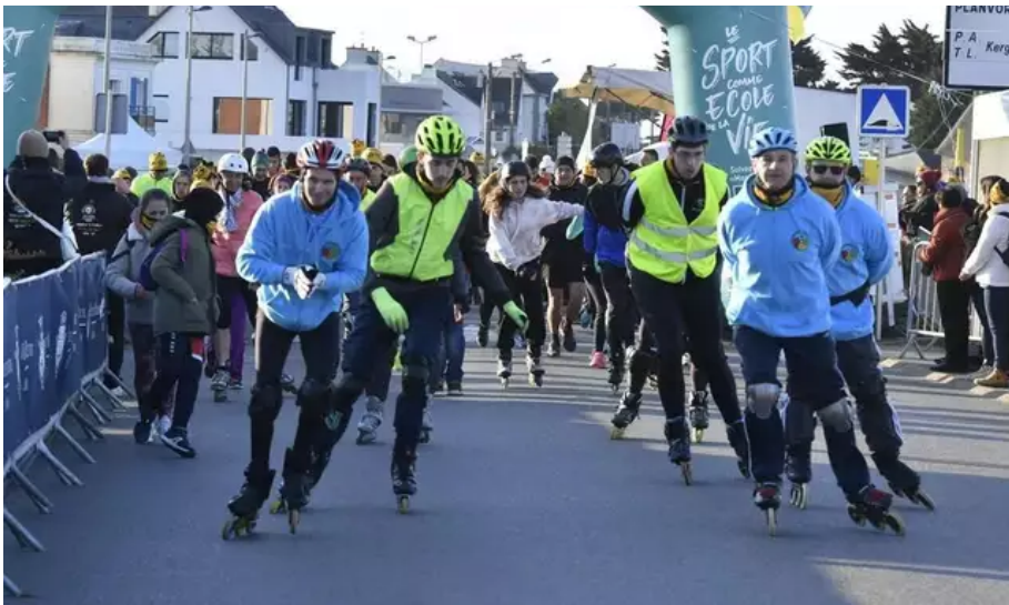
Après deux ans d'absence en raison du Covid, la Littorale 56 fait son grand retour, ce dimanche 3 avril 2022, entre Plœmeur et Guidel (Morbihan).