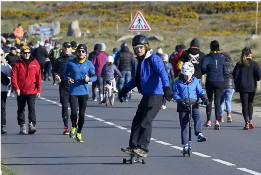
À pied, en roller, en skate, en monocycle, et à vélo pour les moins de dix ans, au profit de la lutte contre le cancer.