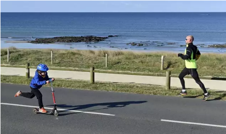
Après deux ans d'absence en raison du Covid, pour sa 9e édition, la Littorale 56 fait son grand retour, ce dimanche 3 avril 2022, entre Plœmeur et Guidel (Morbihan). Une manifestation solidaire contre le cancer, qui réunit coureurs, rollers et skateurs.