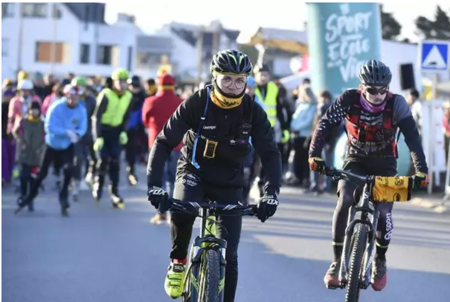
Après deux ans d'absence en raison du Covid, la Littorale 56 fait son grand retour, ce dimanche 3 avril 2022, entre Plœmeur et Guidel (Morbihan).