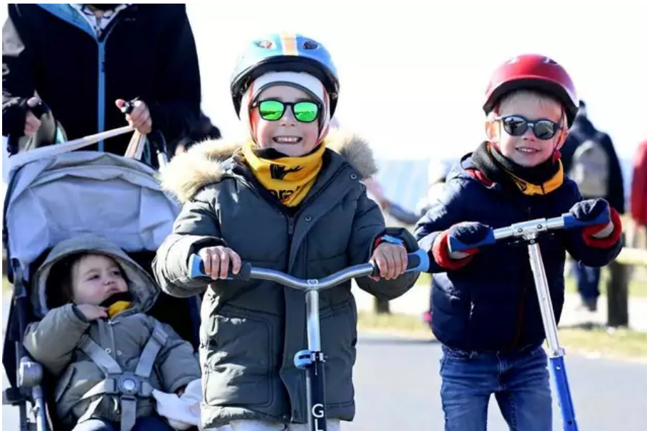
En famille et avec le sourire, malgré le froid, ce dimanche 3 avril 2022.