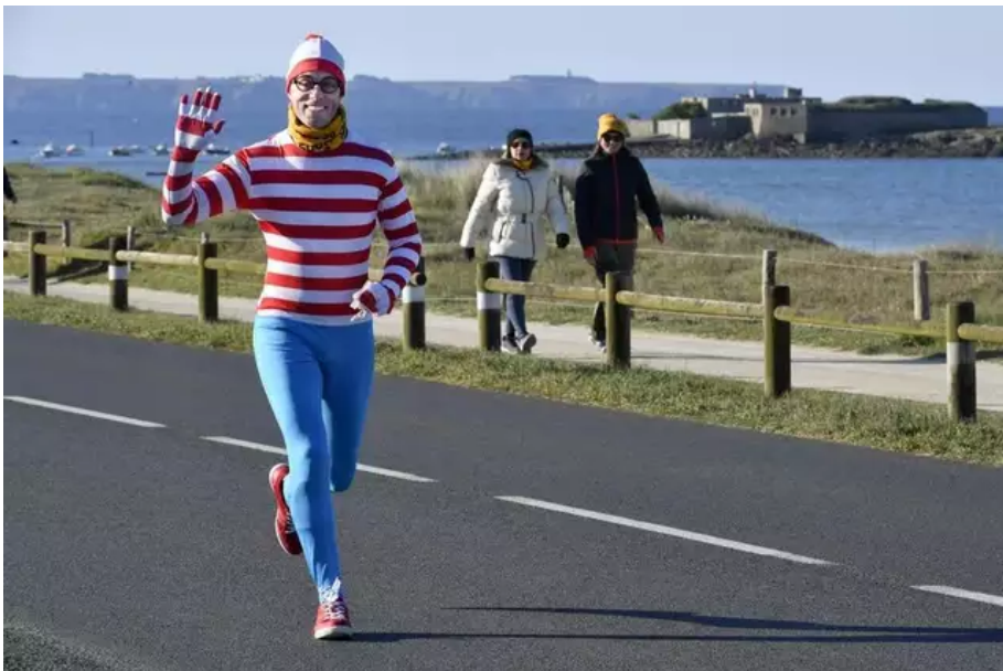
Où est Charlie ? Réponse, à La Littorale 56, ce dimanche 3 avril 2022.