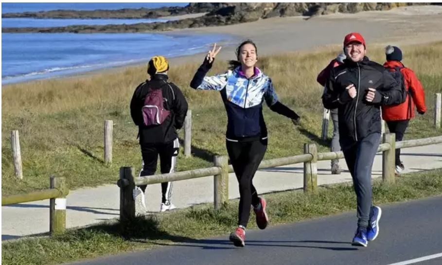
Malgré le froid, les participants avaient le sourire à la Littorale 56, ce dimanche 3 avril 2022.