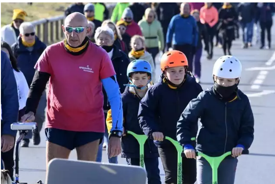
La Littorale 56, à pied, en roller, en trottinette, on n'a pas froid aux yeux !