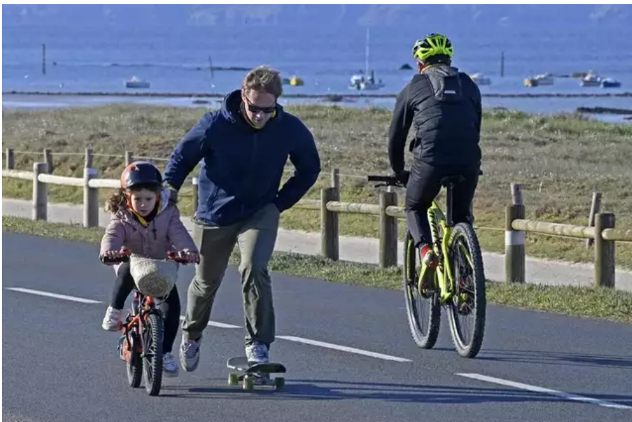
À pied, en roller, en skate, en monocycle, et à vélo pour les moins de dix ans, au profit de la lutte contre le cancer.